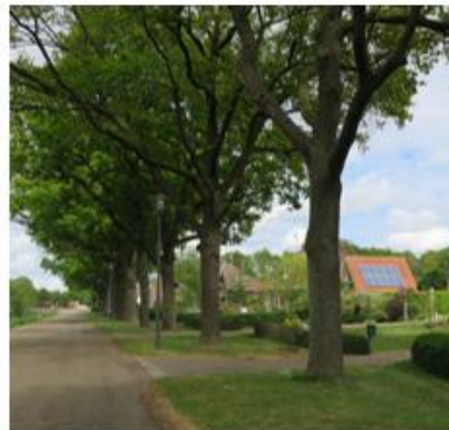
Bomenrij langs Koolhaaspark