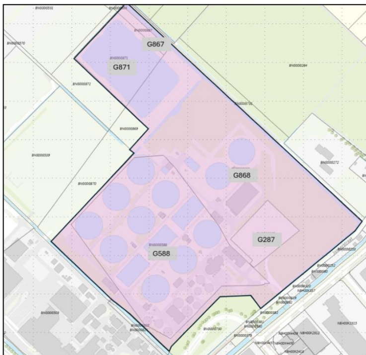
Afbeelding 1 - Kadastrale situatie rwzi Nijmegen

De rwzi Nijmegen is gelegen aan de Jonkerstraat 42, 6551 DK Weurt. De volgende kadastrale percelen maken deel uit van de rwzi Nijmegen: BNG00 G287, G588, G867, G868, en G871.