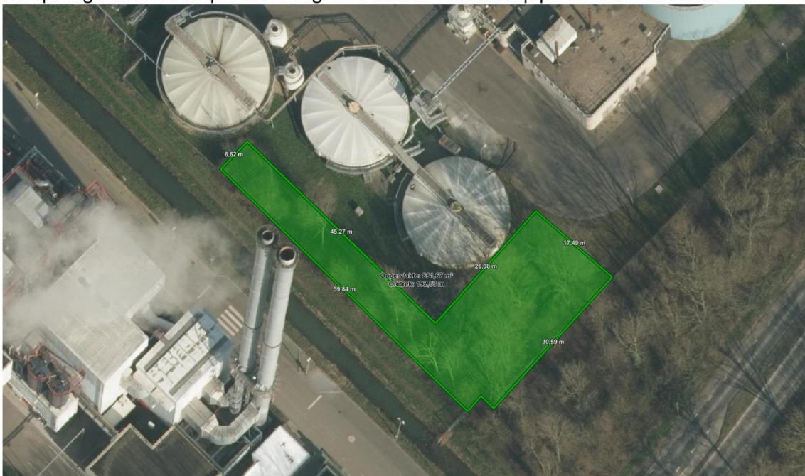
Afbeelding 3 - Indicatieve weergave van te kappen houtopstand (groene markering) circa 880 m2 kroonprojectie

De opvang van de houtopstand is ongeveer 880 m 2 en staat op perceel BNG00 G868.