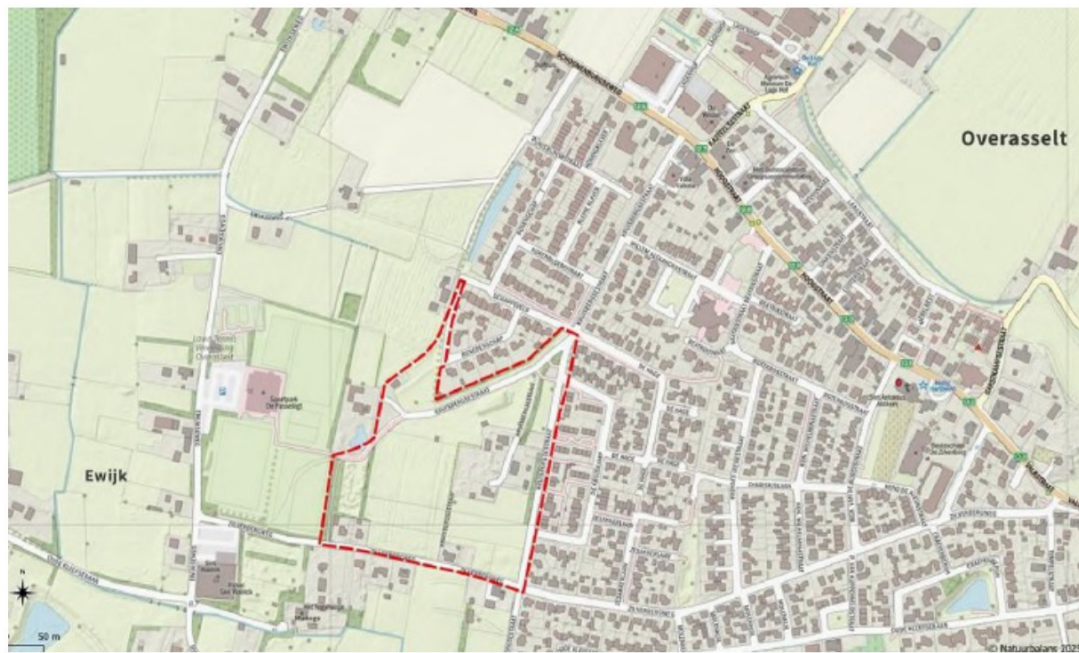
Figuur 1: Locatie plangebied aan de Zilverbergweg en Kruisbergsestraat te Overasselt.