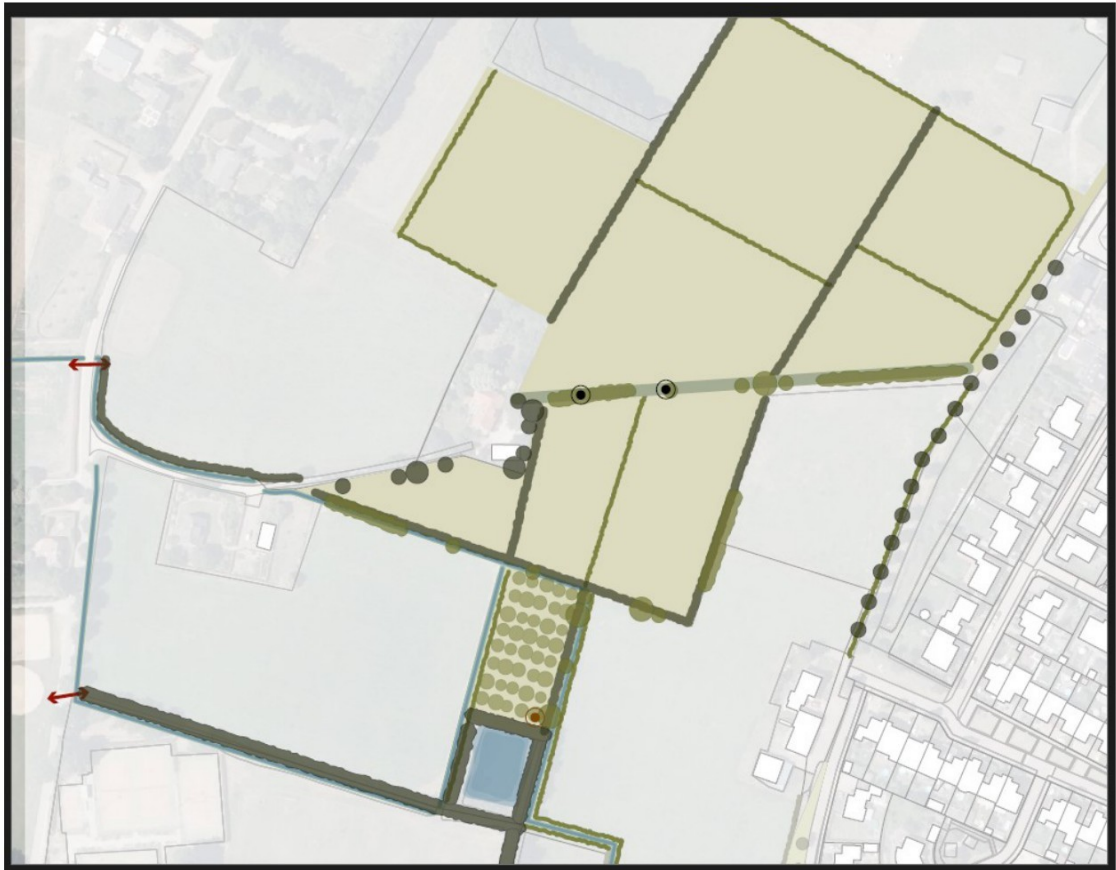
Figuur 6: Beoogde inrichting mitigatiegebied ten noorden van het plangebied (legenda figuur 7)