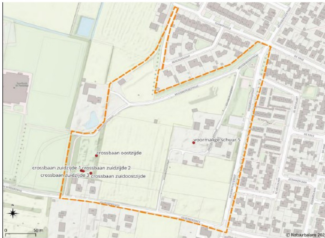
Figuur 4: Aangetroffen dassenpijpen (rood).