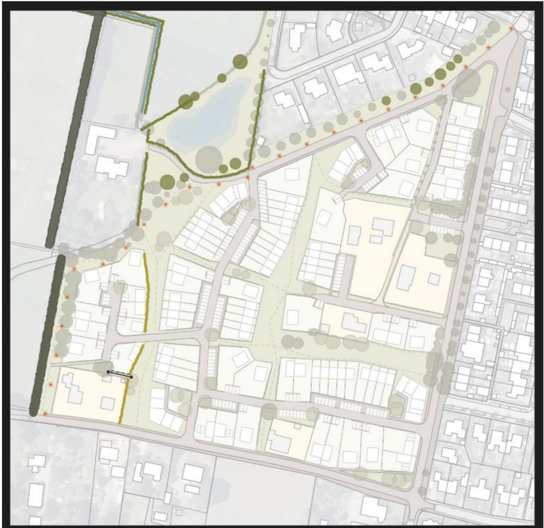
Figuur 5: Beoogde groene inrichting (legenda figuur 7)