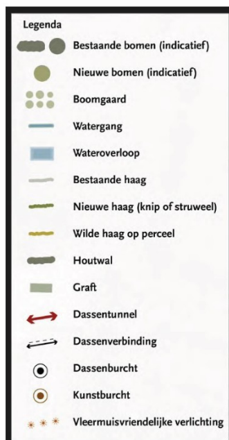
Figuur 7: Legenda behorende bij figuur 5 en 6