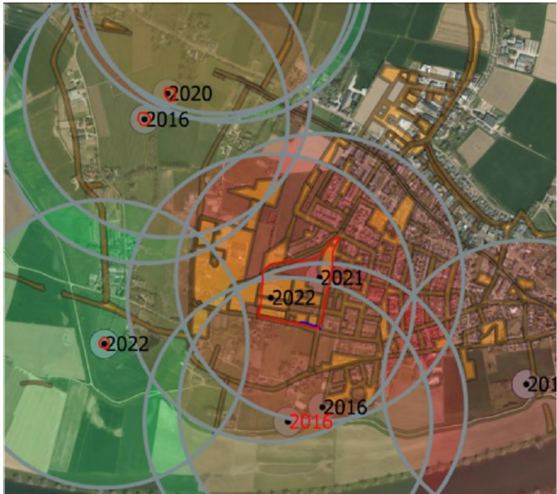
Figuur 8: Dassenpopulaties in de omgeving