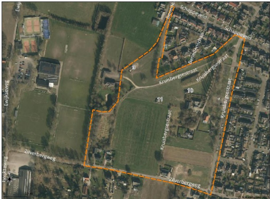
Figuur 2: Locatie te slopen schuren (9, 10 en 11).