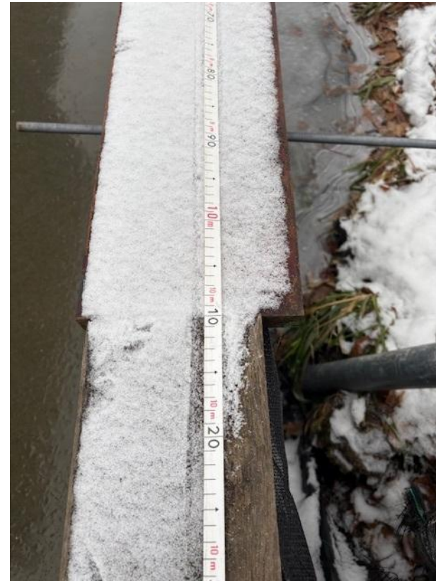
Lengte geplaatste beschoeiing 10 m1