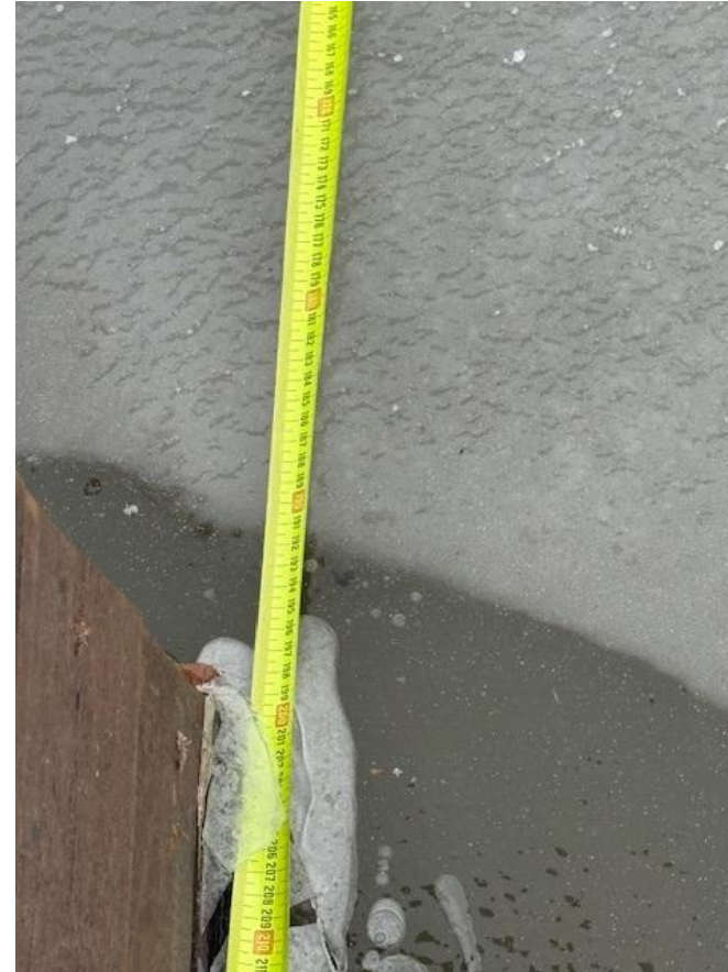
Slootbreedte t.p.v. beschoeiing 2,0m