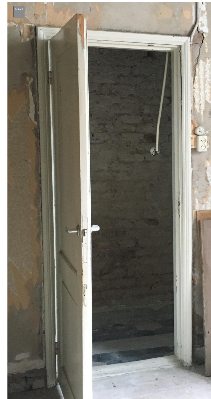
referentiefoto van de oorspronkelijke staat