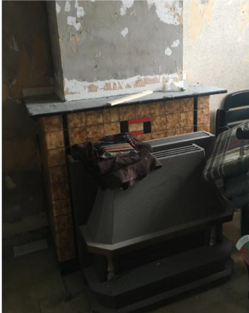
referentiefoto's van de oorspronkelijke staat

tegelwerk ca. 20mm met afgeronde hoektegels