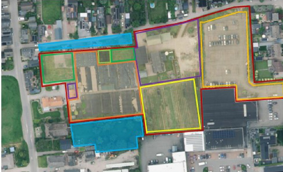
Figuur 1 Plangebied (donkerrood omlijnd) grondgebruik: bomenkwekerij (geel), parkeerplaats (donkergeel), plantenkwekerij (oranje), boomgaardje overdekt met netten (lichtgroen), grasland (donkergroen), woonerf en bebouwing (paars). De moestuin en grote tuin zijn belangrijk foerageergebied en vallen buiten het plangebied.