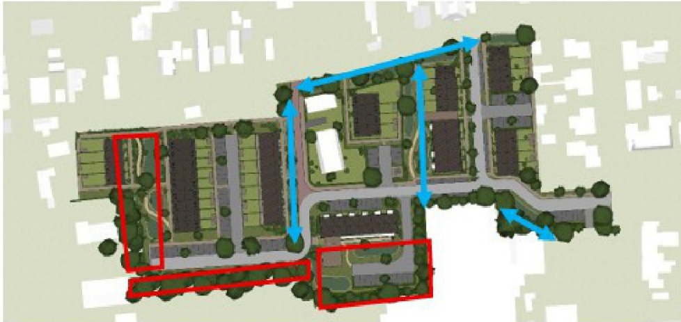
Figuur 2 Functies in de nieuwe situatie voor steenuil: leefgebied (rood), verbindingszone en voedsellocaties (blauw).