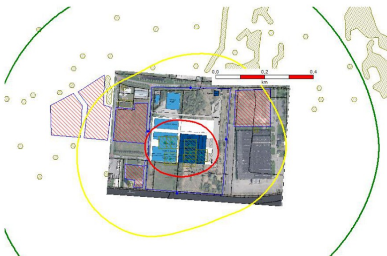
f 3.2 Beoogde situatie (in nieuwe rekenmodel)