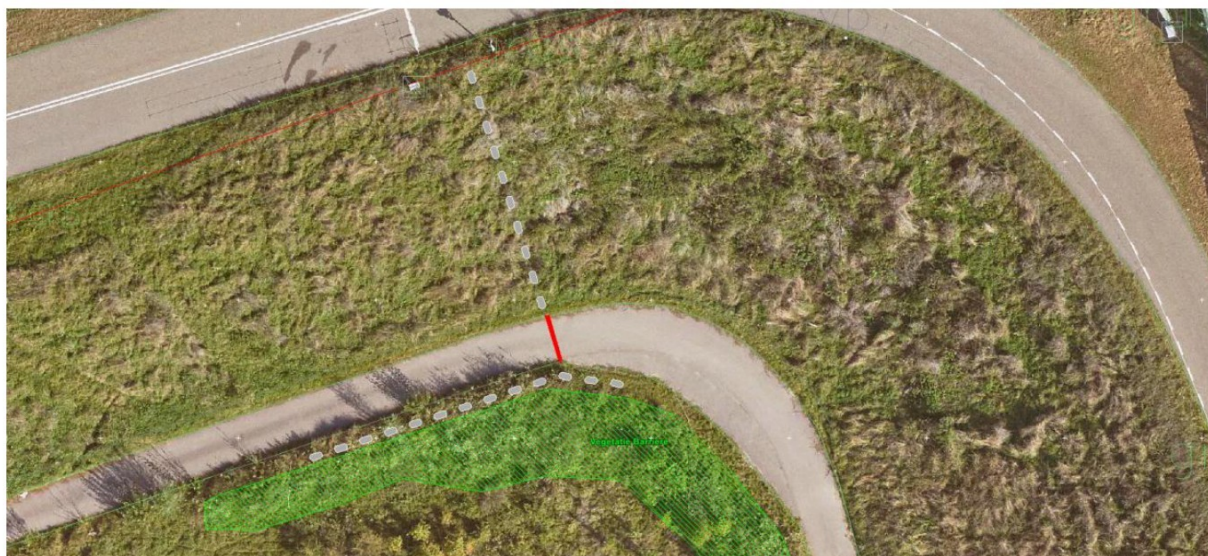
Figuur 3: Bovenaanzicht Nieuwe locatie Jumboblokken en hekwerk