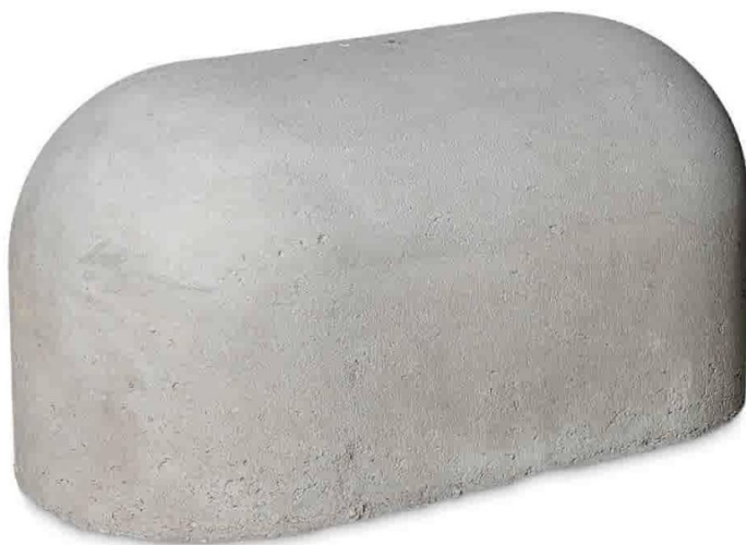
Figuur 2: Jumboblok afmetingen bxhxl 48x45x90cm