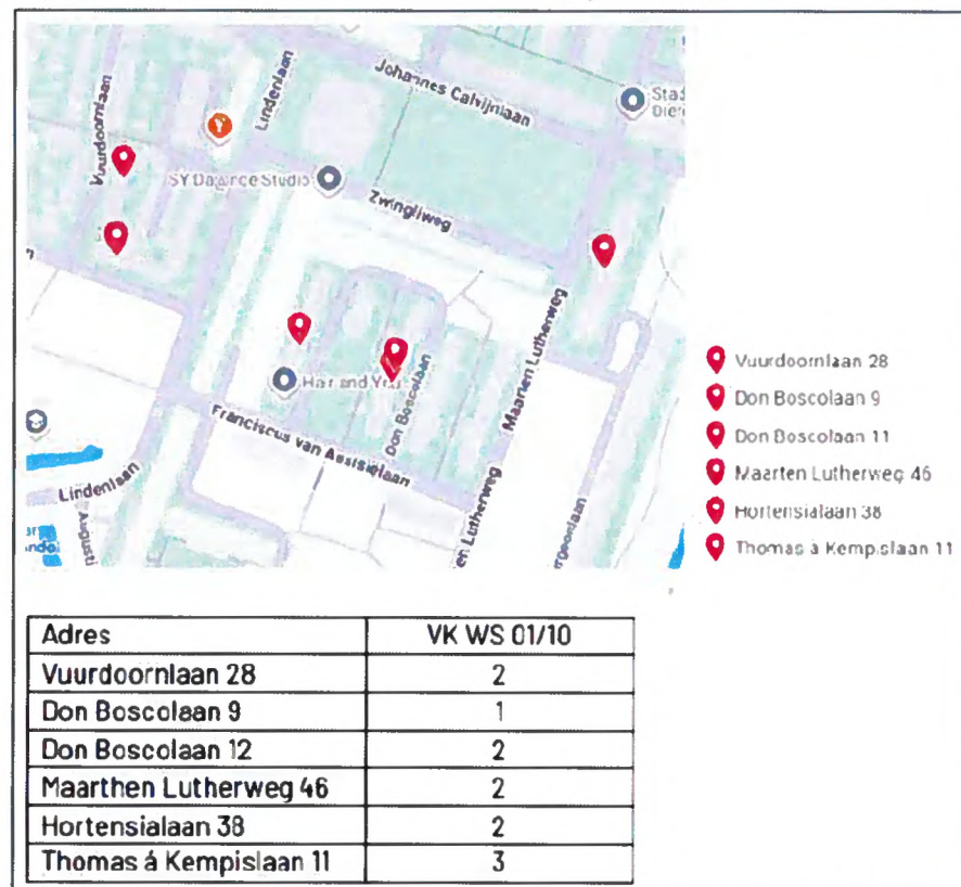
Figuur 1: locaties van de tijdelijke alternatieve verblijfplaatsen. In de tabel wordt aangegeven hoeveel vleermuiskasten er per locatie gerealiseerd worden.