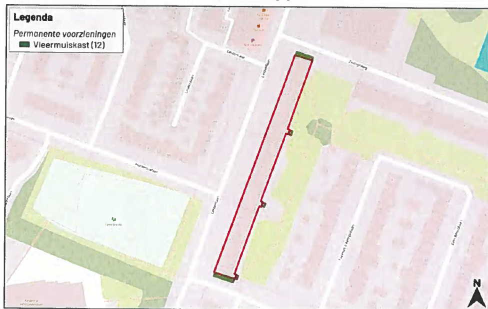
Figuur 1: ocaties van de twaalf permanente alternatieve verblijfplaatsen in de vorm van inbouwkasten weergegeven met groene markeringen.