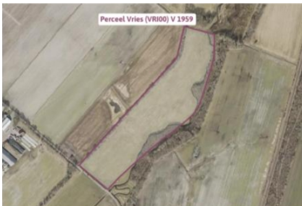
Afbeelding 2: herplant locatie