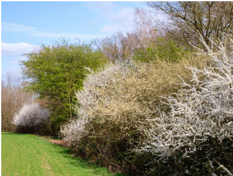
Sfeerimpressie van inheems struweel met boomvormers