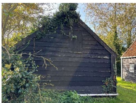
Het dak is overwoekerd