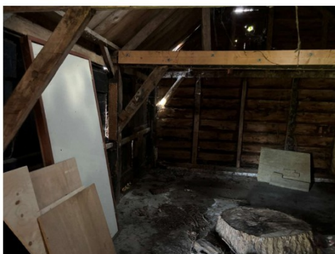
Balken zijn provisorisch gerepareerd