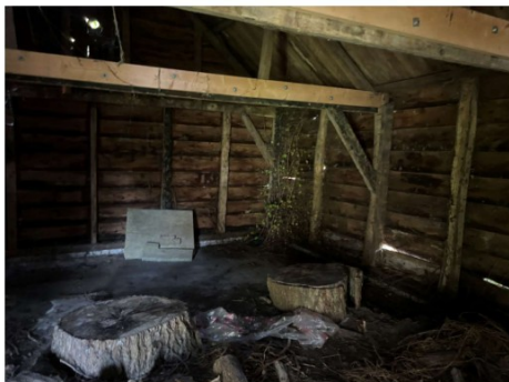
De vloer in zeer slechte staat