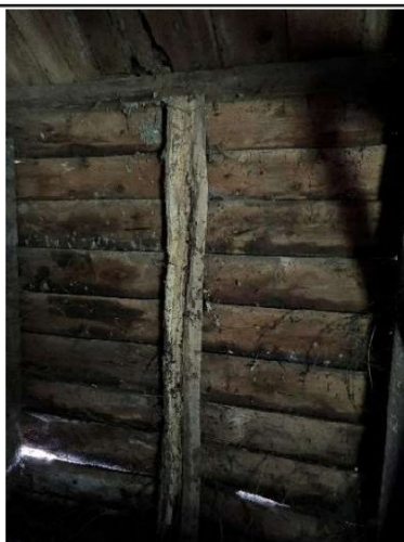
Aantasting door houtrot