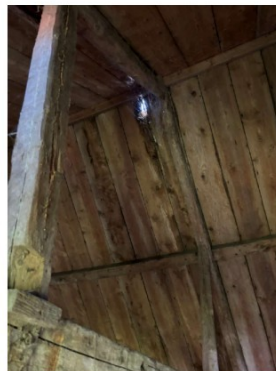
Er zitten gaten in het dakbeschot