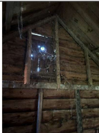
Gaten in de wanden