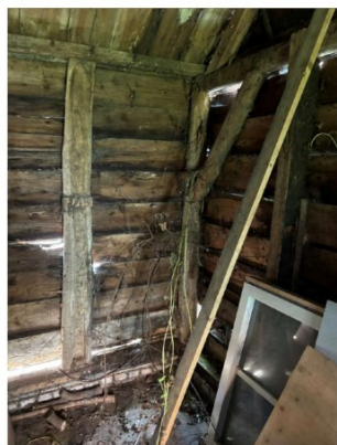
Houtworm aantasting bij constructie