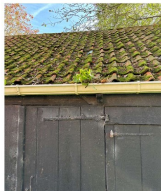
Het dak is begroeid met mos