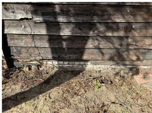
De wanden en fundatie zijn in slechte staat.