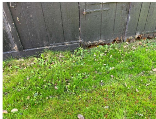
Er zit houtrot in het hout