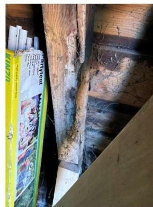
Aantasting constructie door houtrot