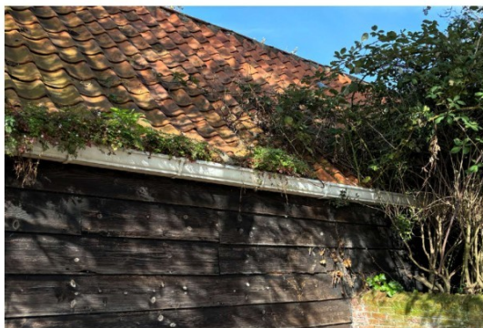
Het dak is in slechte staat