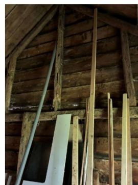
Aantasting door houtworm