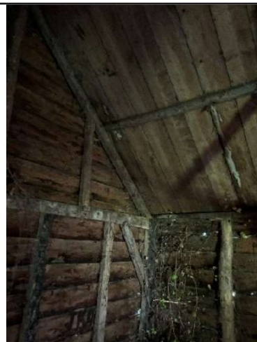
Klimplanten groeien naar binnen