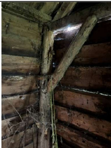
Constructie in slechte staat