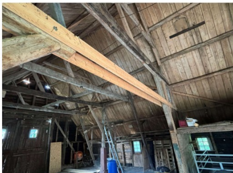
Dak in slechte staat