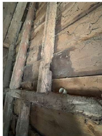
Aantasting door houtworm