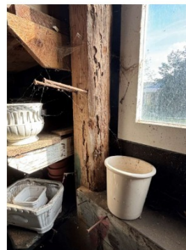
Aantasting door houtworm