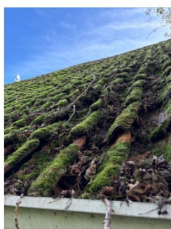
Schade aan het dak, het dak is met mos begroeid