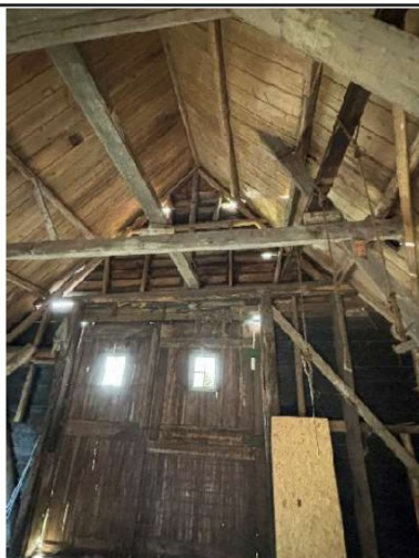
Overzicht dak en constructie