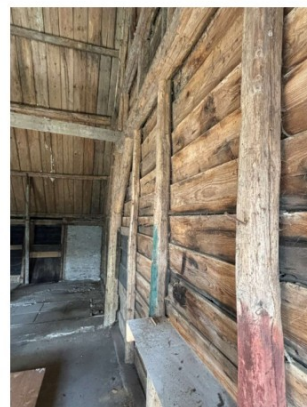
Constructie aangetast door houtworm