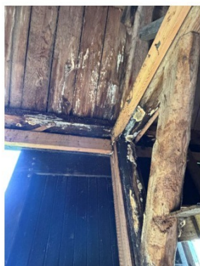
Schimmelvorming op het dakbeschot