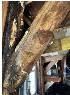
Aantasting door houtrot in de balken