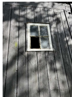
De kozijnen zijn eind levensduur