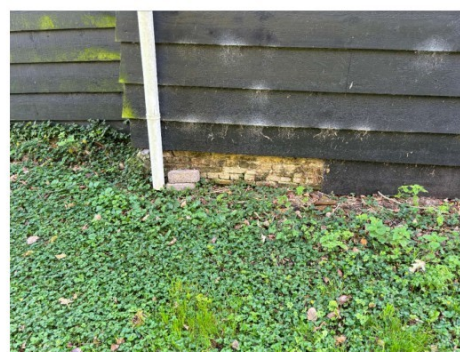
Fundatie in slechte staat