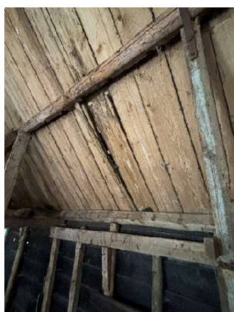
Schade aan het dakbeschot