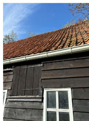
Het dak is verzakt