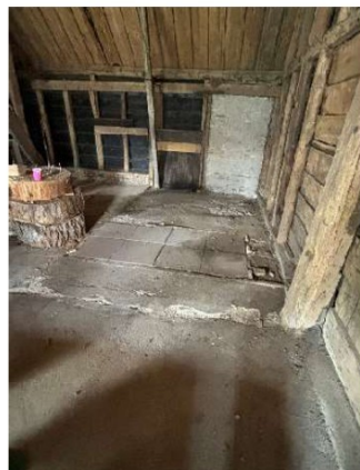
Vloer en wanden in slechte staat