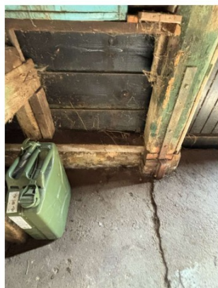
Schade aan houtconstructie en vloer