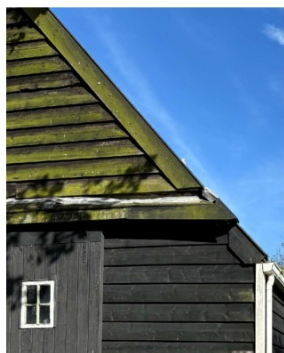
Schade aan de gevel van de schuur