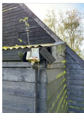
Schade aan de gootconstructie