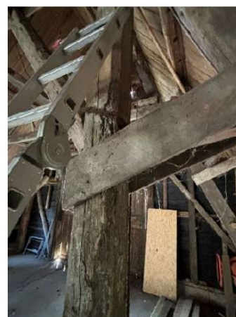
Aantasting aan de constructie