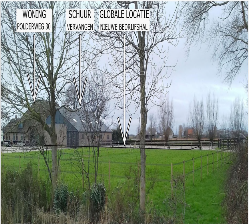
FOTO 1: BESTAANDE SITUATIE VANAF INRIT OOSTERWEG 6 FOTO GENOMEN VANUIT HET NOORDEN