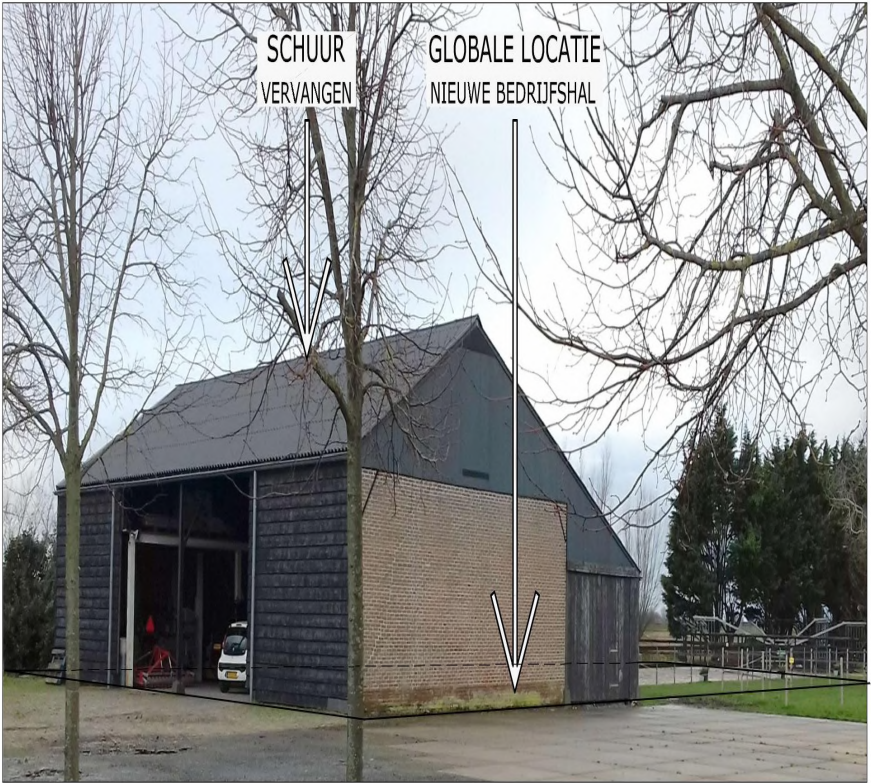
FOTO 2: BESTAANDE SITUATIE VANAF ERF POLDERWEG 30 FOTO GENOMEN VANUIT HET ZUID-OOSTEN