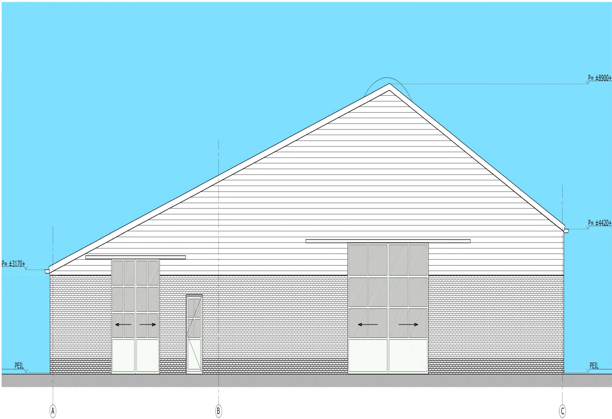
NOORD-WESTGEVEL ZIJDE BUREN OOSTERWEG 6