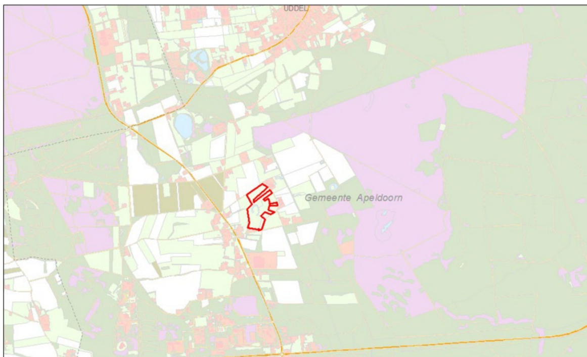
Kaart met aanduiding plangebied

De percelen zijn in gebruik als grasland voor productie veevoer. Bijna alle percelen in het projectgebied zijn eigendom van de Provincie Gelderland, drie percelen zijn van een particuliere eigenaar die wil meedoen aan het project.