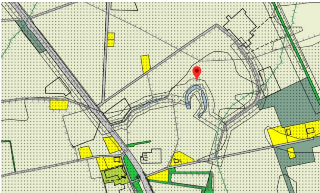
kaart van het plangebied in het omgevingsplan