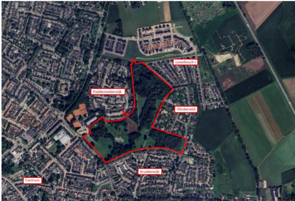
Afbeelding 1: ligging van het plangebied.

Het ontgrondingsgebied is gelegen aan de oostzijde van de gemeente Asten op ongeveer 600 meter van het centrum. Het evenemententerrein en het nabijgelegen park Loverbos, inclusief enkele bospercelen, worden heringericht tot een volwaardig park.