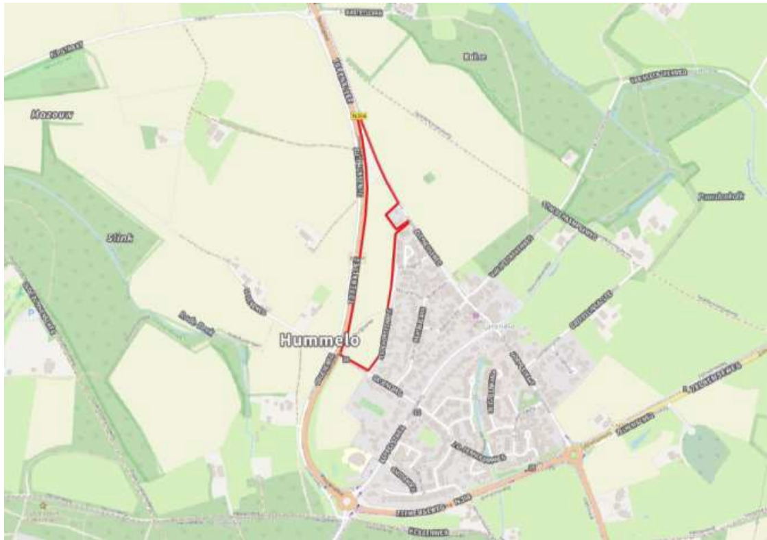
Figuur 2: De begrenzing van het plangebied tussen de N314 en Stokhorsterweg is in rood aangegeven.