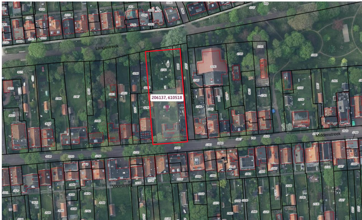
Figuur 2.1 Luchtfoto van het projectgebied vanuit PDOK-viewer

Het projectgebied ligt midden in het dorp aan de Middenstreek 40 Schiermonnikoog. Het betreft de overtuin behorende bij de woning aan de Middenstreek 40 Schiermonnikoog. In de overtuin wordt een berging gebouwd.