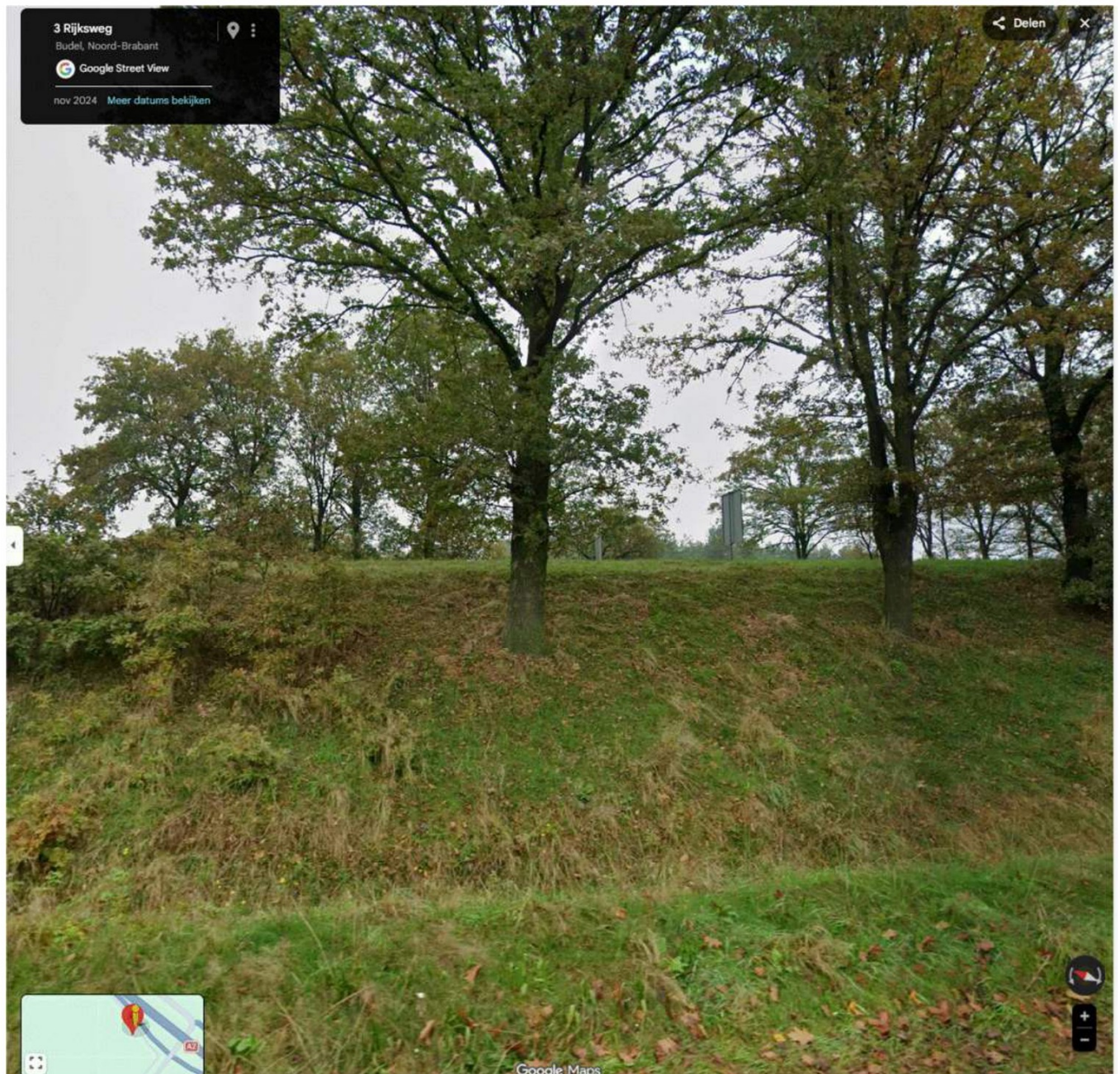
Zicht vanuit de Rijksweg 5 Budel richting Weerter en Budelerbergen & Ringselven