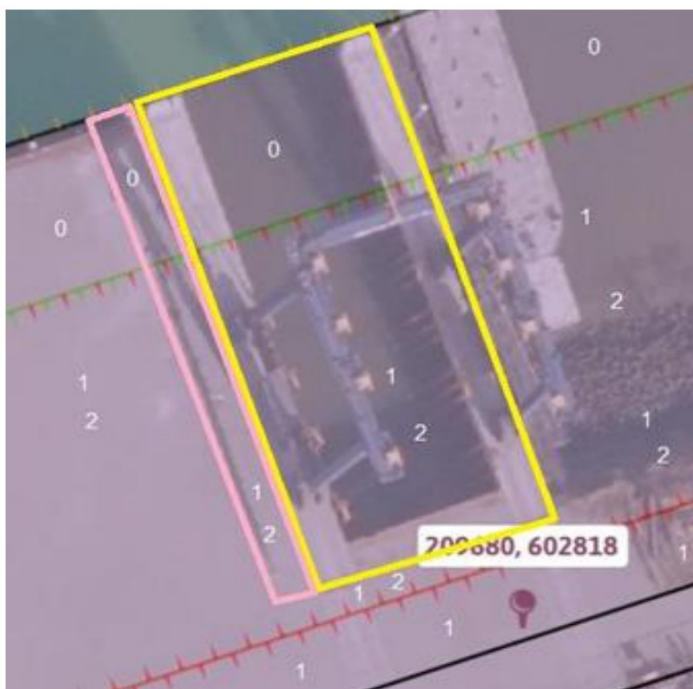
Figuur 1 en 2: De locatie van de bestaande insteekhaven (blauwe pijl) voor de scheepslift (geel rechthoek) en de nieuwe rijstrook (verbreding), inclusief de aanduiding van de planologische zones.