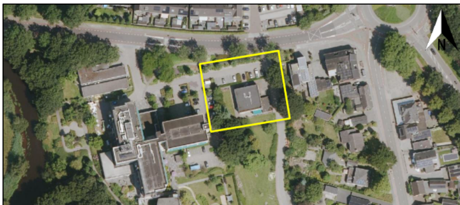
Figuur 1. Overzichtskaart werkzaamheden

Onderzoek naar het voorkomen van beschermde soorten heeft uitgewezen dat zich binnen het plangebied onder andere een kraamverblijfplaats van de gewone dwergvleermuis bevindt, waar 44 individuen zijn geteld tijdens het uitvliegen. Figuur 2 toont de locatie van de aangetroffen kraamverblijfplaats. Voortvloeiend uit voorschrift 20 van de genoemde gebiedsontheffing zijn deze verblijfplaatsen te kenmerken als een 'bijzondere verblijfsfunctie', waarvoor een goedkeuringsbesluit nodig is.