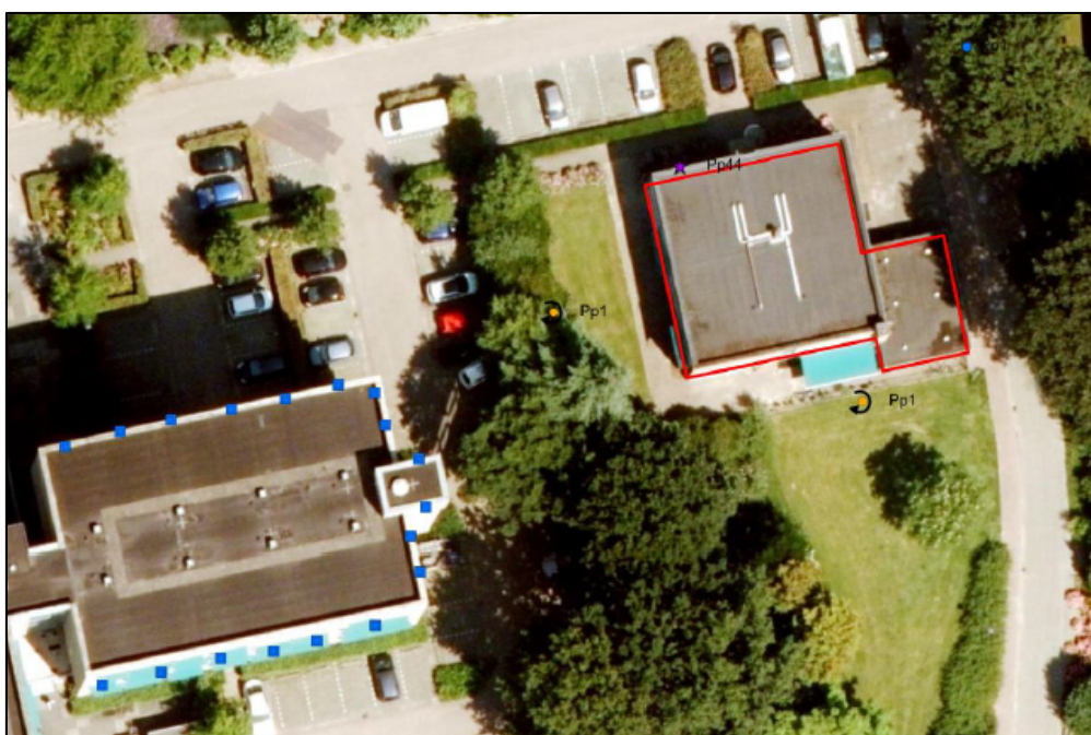
Figuur 2. Overzichtskaart locatie kraamverblijfplaats (paarse ster) en de tijdelijke voorzieningen (blauwe vierkantjes).

Onderzoek naar het voorkomen van beschermde soorten heeft uitgewezen dat zich binnen het plangebied onder andere een kraamverblijfplaats van de gewone dwergvleermuis bevindt, waar 44 individuen zijn geteld tijdens het uitvliegen. Figuur 2 toont de locatie van de aangetroffen kraamverblijfplaats. Voortvloeiend uit voorschrift 20 van de genoemde gebiedsontheffing zijn deze verblijfplaatsen te kenmerken als een 'bijzondere verblijfsfunctie', waarvoor een goedkeuringsbesluit nodig is.