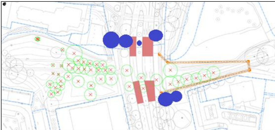
Figuur 1. De recentste kaptekening. In het blauw is aangegeven welke bomen behouden blijven ten opzichte van de oorspronkelijke vergunning.