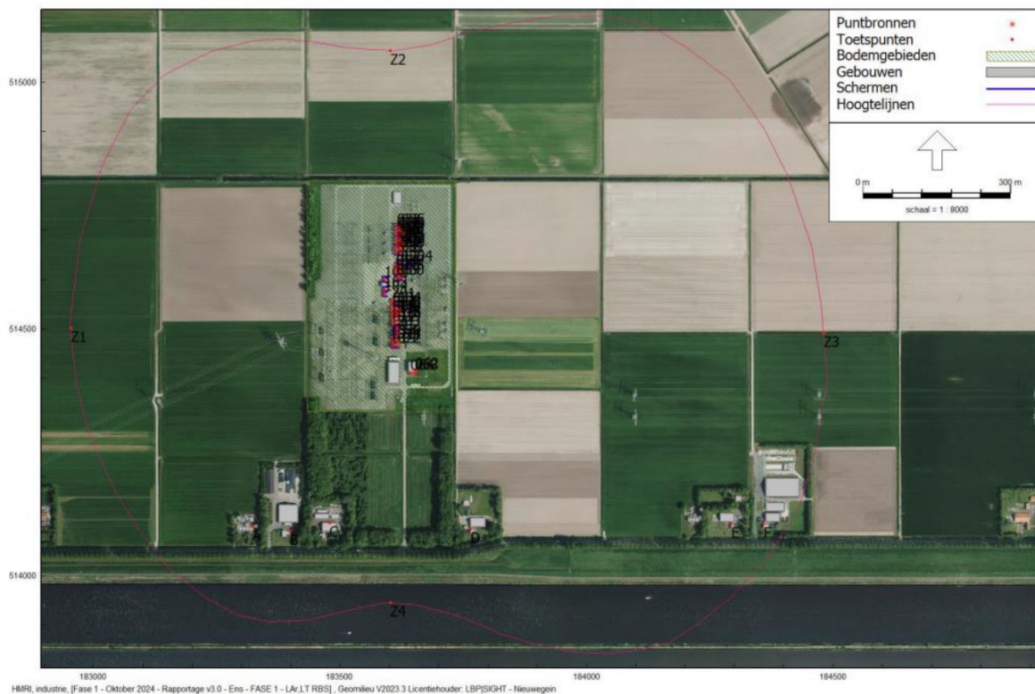
Figuur 1: Overzicht geluidmodel en ligging geluidzone en rekenpunten