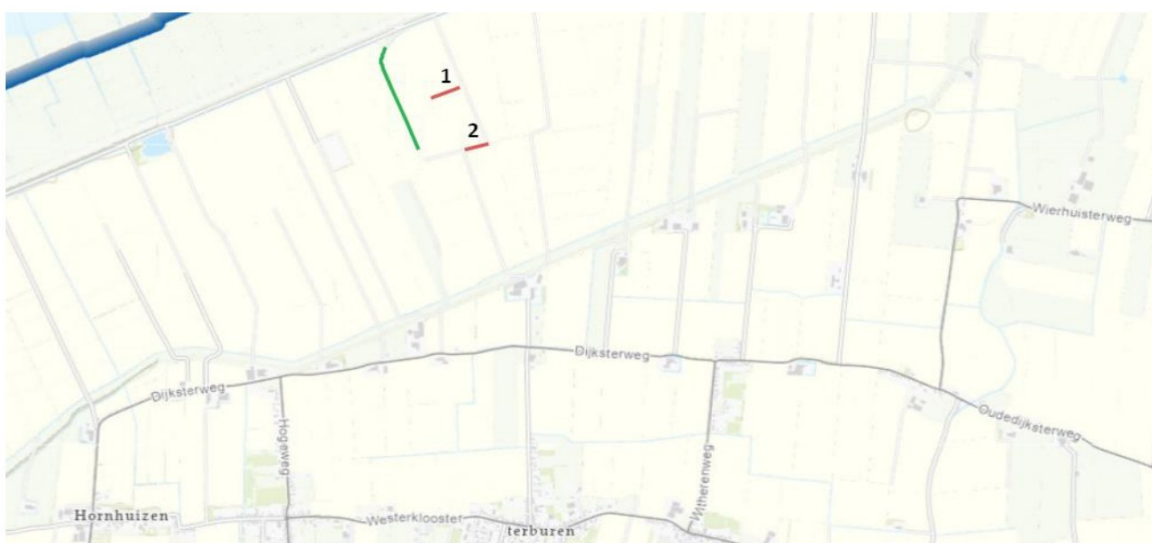
Figuur 1: Locatie van activiteiten. De rode lijnen (1 en 2) geven de te dempen watergangen weer. De groene lijn geeft de te verbreden watergang weer.

Het dagelijks bestuur van het waterschap Noorderzijlvest heeft op 18 maart 2026 van [REDACTED] namens [REDACTED] een aanvraag ontvangen om een omgevingsvergunning als bedoeld in artikel 5.1, tweede lid, van de Omgevingswet (Ow). De aanvraag betreft het dempen van oppervlaktewaterlichamen en het verbreden van een oppervlaktewaterlichaam nabij Bokum 3 te Kloosterburen, zoals hieronder globaal is weergegeven in figuur 1.