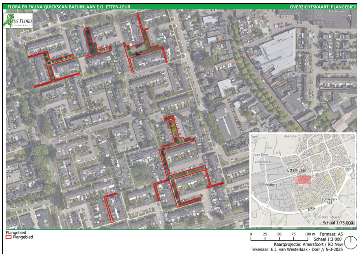
Figuur 1. Locatie aan de Bazuinlaan, Cimbaalhof en Waldhoornlaan in Etten-Leur. Enkele looppaden die weergegeven zijn op de kaart zijn niet meegenomen in de maatregelen, gezien hier groenstructuren ontbreken. De activiteiten vinden plaats binnen de omliggende gebieden.