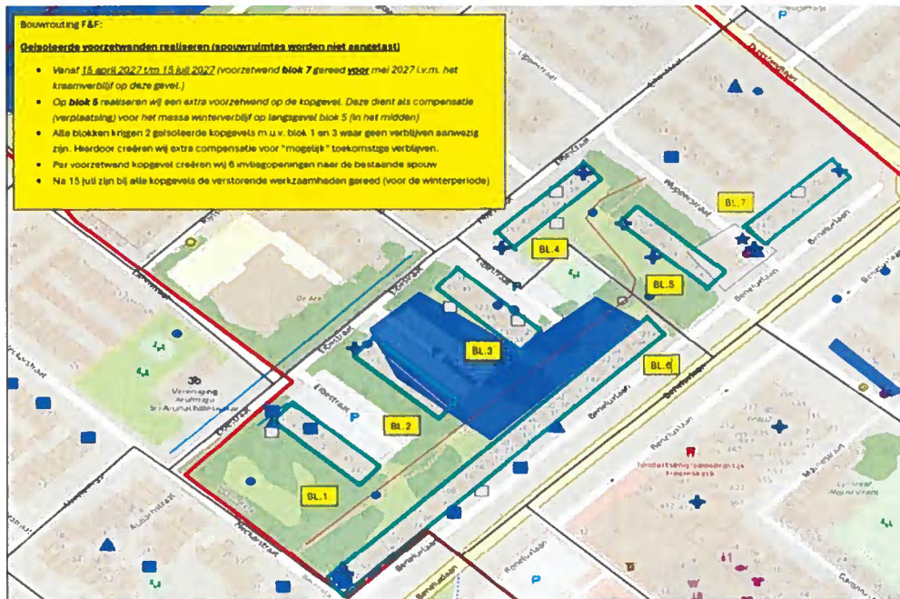
Figuur 1: Plangebied met aanduiding locaties met woonblokken die verduurzaamd gaan worden.