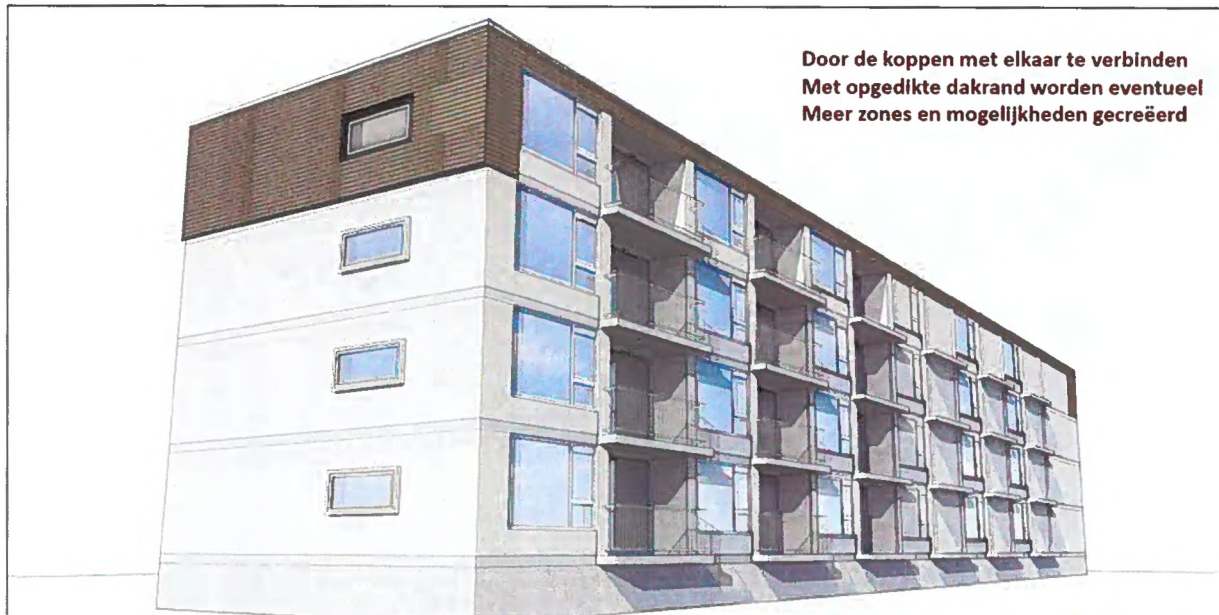
Figuur 3: Extern aanzicht van de voorziening