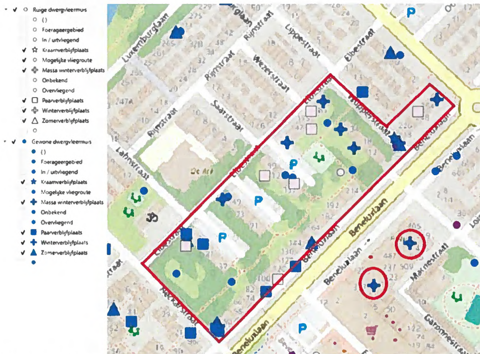
Figuur 2: Plangebied met alle gevonden verblijfplaatsen. Ten oosten van het plangebied (oost van de Beneluxlaan) bevinden zich twee massawinterverblijfplaatsen die onaantast blijven (in rood omcirkeld) en dienen als uitwijkmogelijkheden. Aan deze verblijfplaatsen mogen geen werkzaamheden plaatsvinden gedurende de werkzaamheden binnen het plangebied.