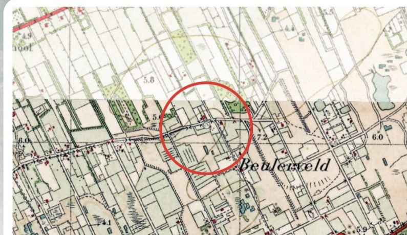
Fragment uit 1925