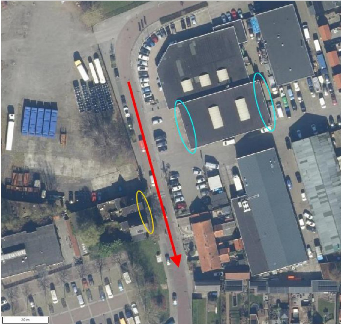
Fig. 1. Locaties van de gierzwaluwnesten (gele cirkel), de gierroute (rood) en de gevels van de loods (cyaan) waaraan de tijdelijke kasten worden opgehangen. Bron kaartondergrond: Regels op de Kaart