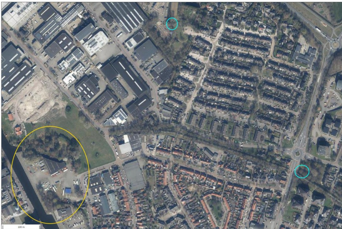
Fig. 2. Locatie geschikt leefgebied steenmarter binnen plangebied (geel omcirkeld) en locaties nieuwe marterkasten (cyaan).