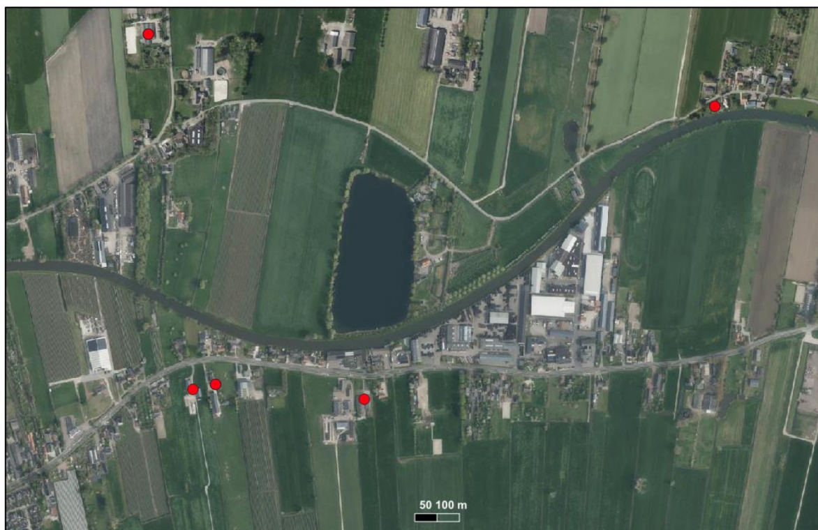
Figuur 4 Locaties van veehouderijen in de omgeving van Mastwijkerdijk 138a.

Indien een geurgevoelig object buiten de bebouwde kom staat, schrijft de wet een vaste afstand van 50 meter voor tussen de veehouderij en dit object. Artikel 4 van de verordening verkleint deze afstand tot 25 meter. Dit geldt alleen voor bestaande dierenverblijven en geurgevoelige objecten (lid 2 en 3). Dat betekent dat nieuwe dierenverblijven en nieuwe geurgevoelige objecten op de wettelijke afstand van 50 meter moeten worden gerealiseerd. Hieraan wordt voor de Mastwijkerdijk 138a ruimschoots aan voldaan. De dichtstbijzijnde veehouderij ligt op ca. 280 m afstand. Door deze minimale afstand van 280 m zal cumulatie met de overige veehouderijen niet leiden tot een onaanvaardbaar woon- en leefklimaat.