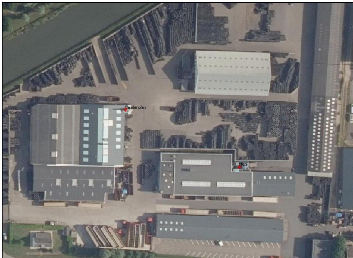
Figuur 3 Locatie geurbronnen Kargro BV (aangeduid door rode asterisk)

In overleg met Kargro is de bedrijfssituatie voor deze geurbronnen afgestemd. Uit de vergunde situatie blijkt voor deze bronnen de volgende kenmerken: