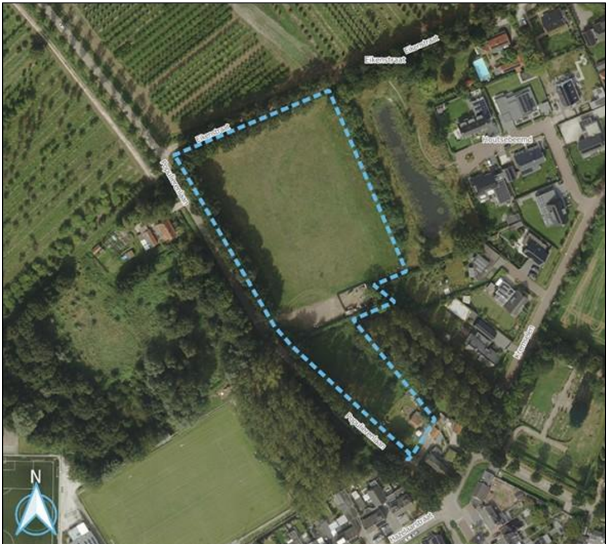
Figuur 1. Locatie Sportveld, Boskant. De activiteiten vinden plaats binnen het omliggende gebied.