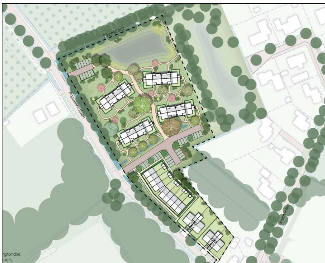
Figuur 3. Toekomstige situatie plangebied.