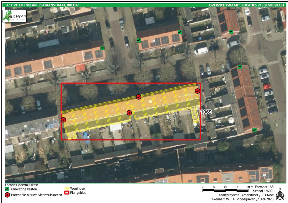
Figuur 2. Locatie van de tijdelijke en permanente voorzieningen.