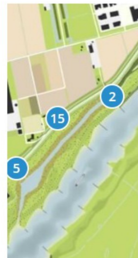
Figuur 1 a en b: Totale omvang geulgebied Plasserwaard. Links de huidige situatie en afbakening van het geulgebied, rechts de voorgenomen nieuwe inrichting.