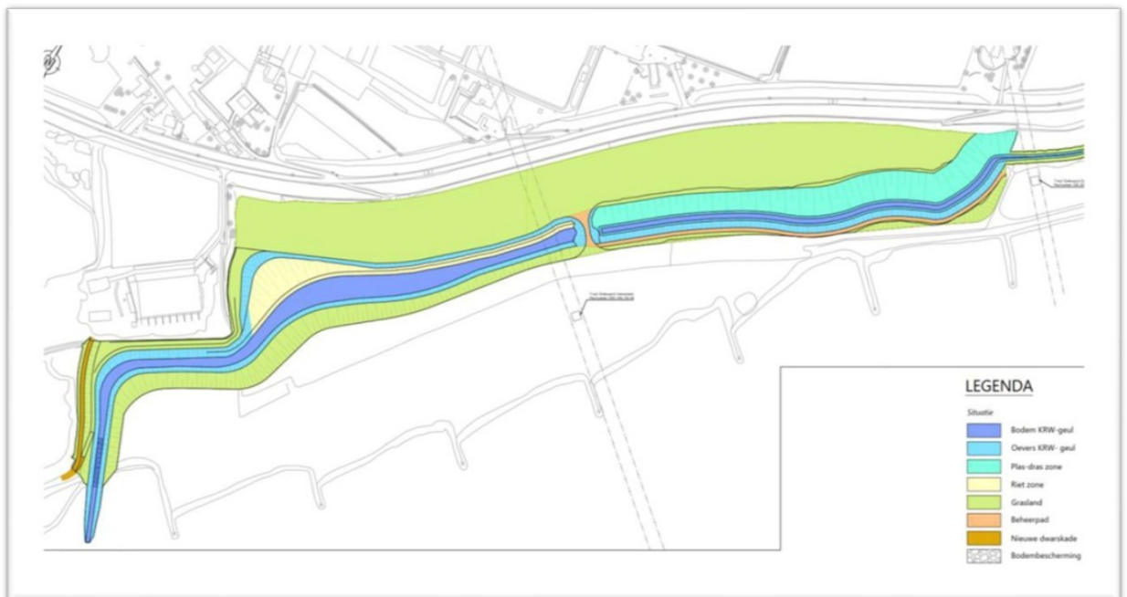
Figuur 2: overzicht plangebied Plasserwaard.

De dijkversterking Grebbedijk bevindt zich tussen de Wageningse Berg (Veluwe) aan de oostzijde en de Grebbeberg (Utrechtse Heuvelrug) aan de westzijde langs de rivier de Rijn. Het geulgebied Plasserwaard (Wageningen) wordt ontgraven met het doel om ecologische doeleinden zoals aangegeven in de KRW te behalen. De klei die ontgraven zal worden uit het geulgebied zal gebruikt worden voor de dijkversterking.