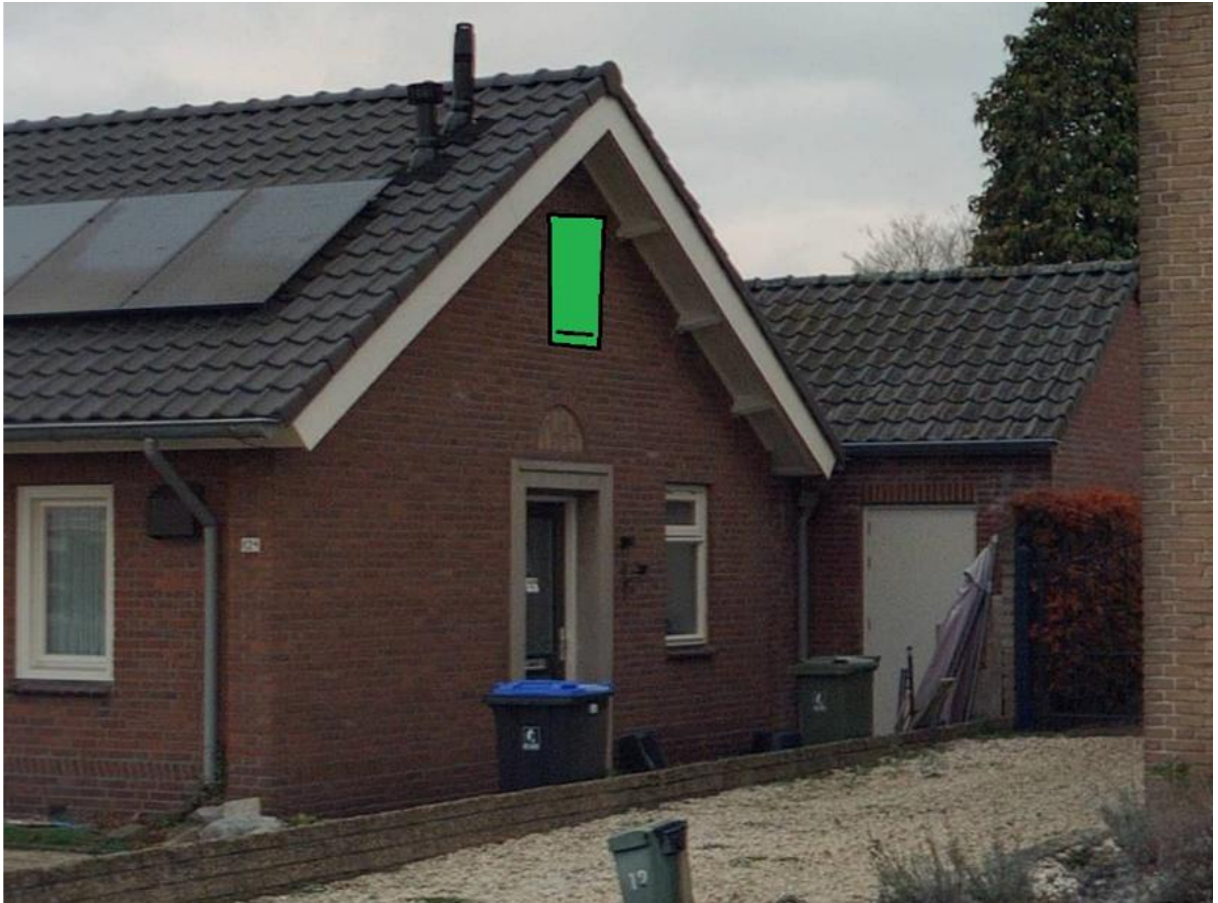
Figuur 2. Locatie vleermuiskast bij Wilhelminstraat 12a te Mill.