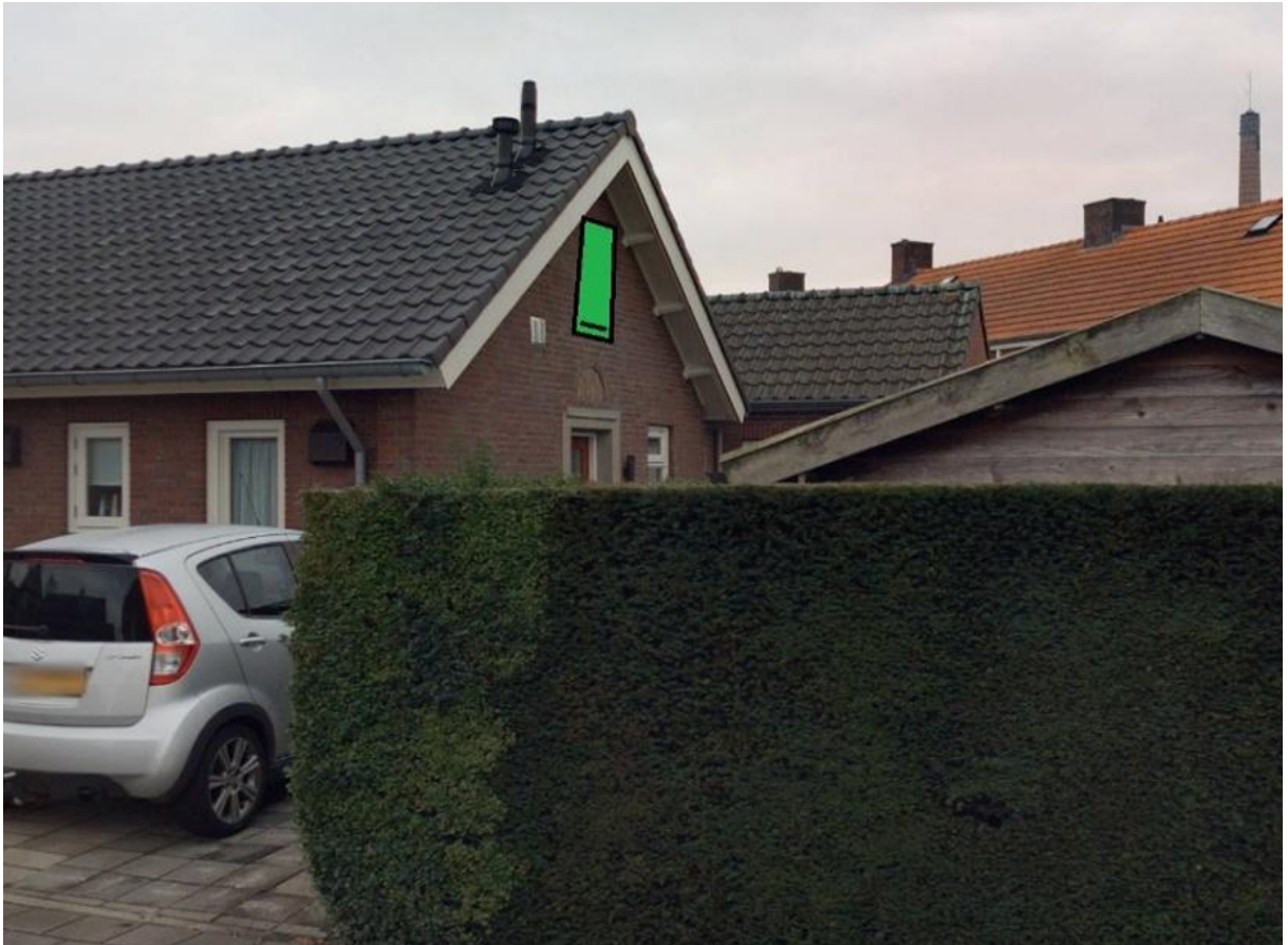
Figuur 4. Locatie vleermuiskast bij Wilhelminstraat 17 te Mill.