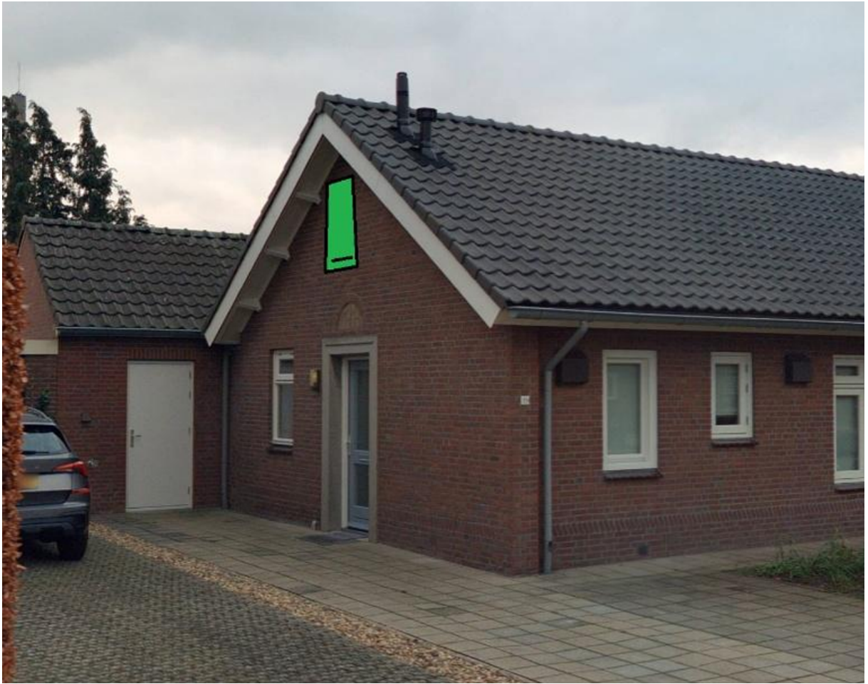
Figuur 3. Locatie vleermuiskast bij Wilhelminstraat 11 te Mill.