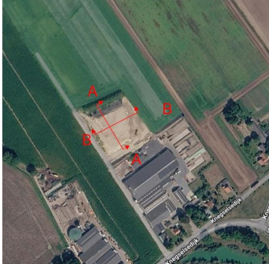
Nog af te ronden deel van de ontgroning

Met uitzondering van een zanddepot is de ontgroning op het perceel afgerond.