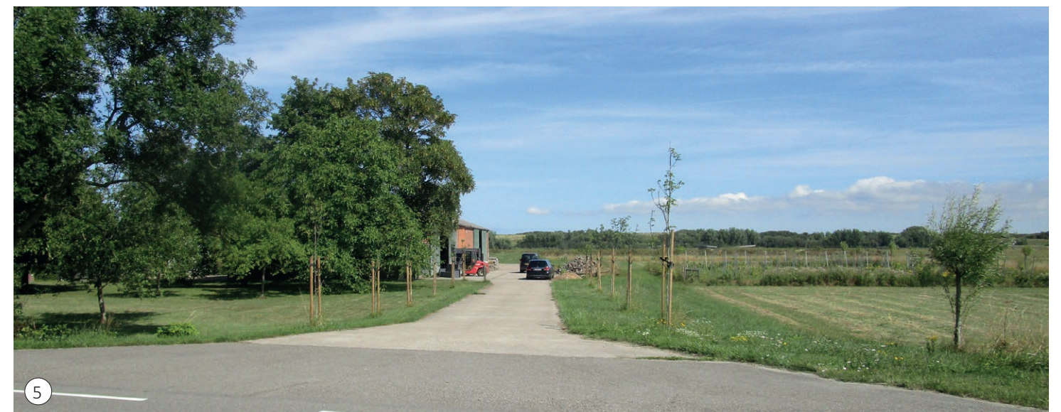
5 Aan weerszijden van de oprit is een rij notenbomen aangeplant.