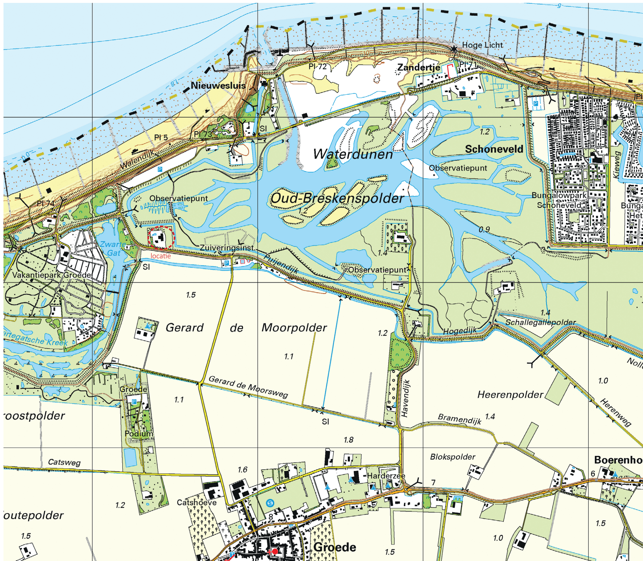
Topografische kaart 2024 (topografische kaart www.pdok.nl ).

Project: Familie [redacted] Puijendijk 1 4503 PL Groede Datum: 2 september 2025 Projectnummer: 464