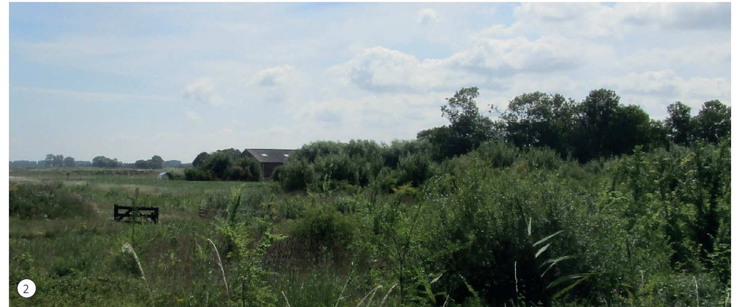
2 Beperkt zicht op de aanwezige bebouwing op de door het aanwezige groen op en rond de locatie.