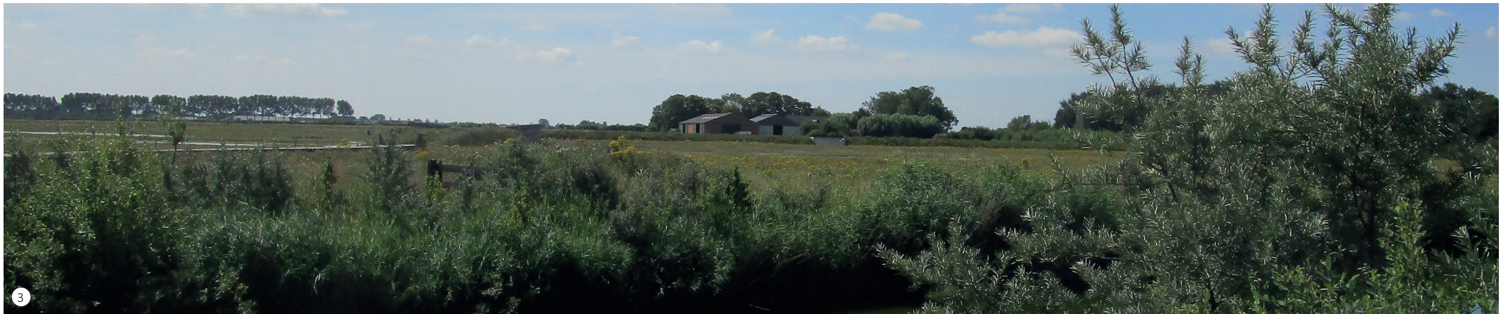
3 Zicht op de locatie vanaf de noordelijk gelegen ingang van het natuurgebied, met name de nieuwere schuur aan de rechterzijde springt in het oog.