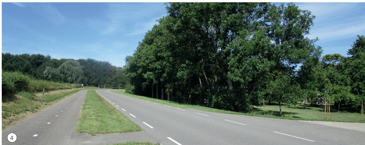
4 Aan de voorzijde van het perceel is een dichte rij bomen en struiken aanwezig die het zicht op de achterliggende bebouwing ontnemt.