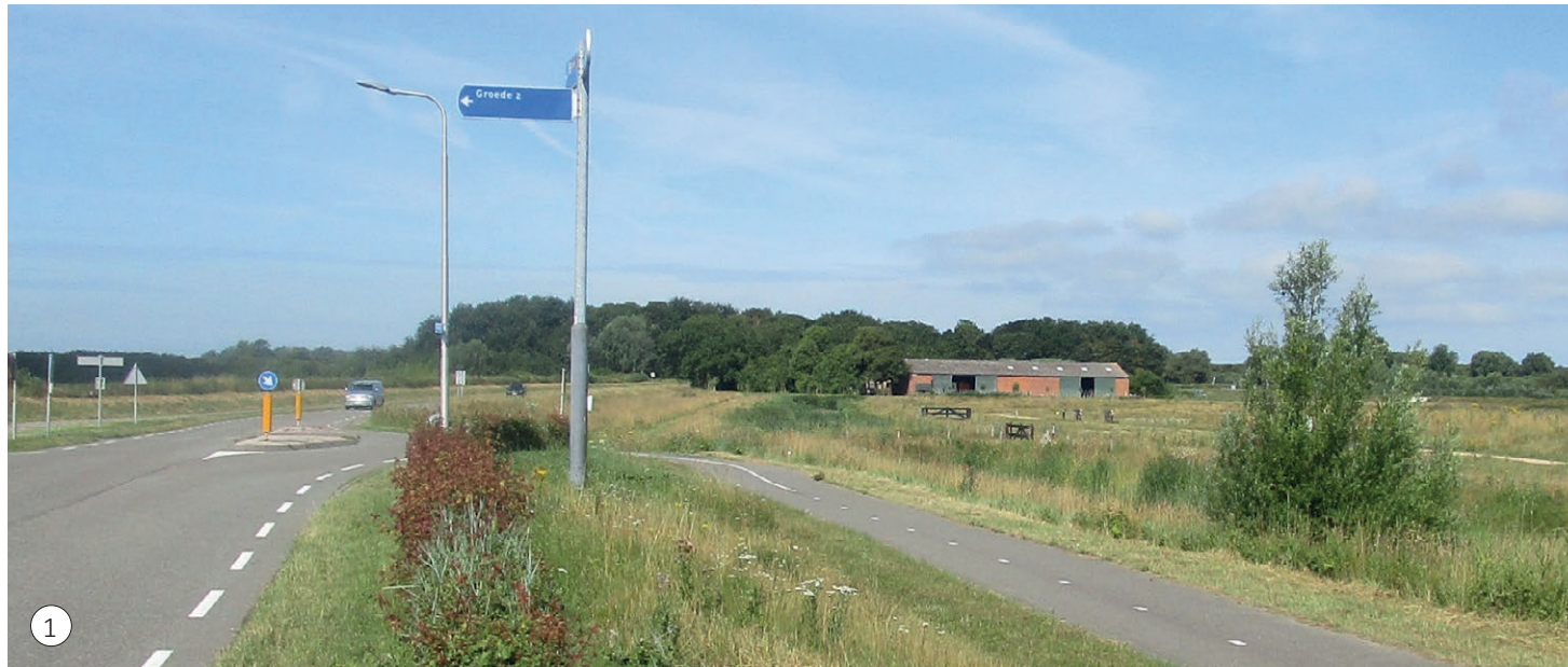
1 Zicht vanaf de t-splitsing Noordweg- Puijendijk op de locatie, met op de voorgrond het natuurgebied Waterdunen.