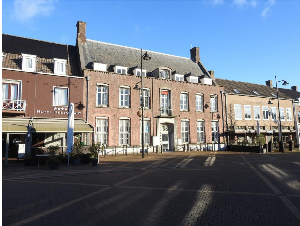
Voorgevel Markt 3