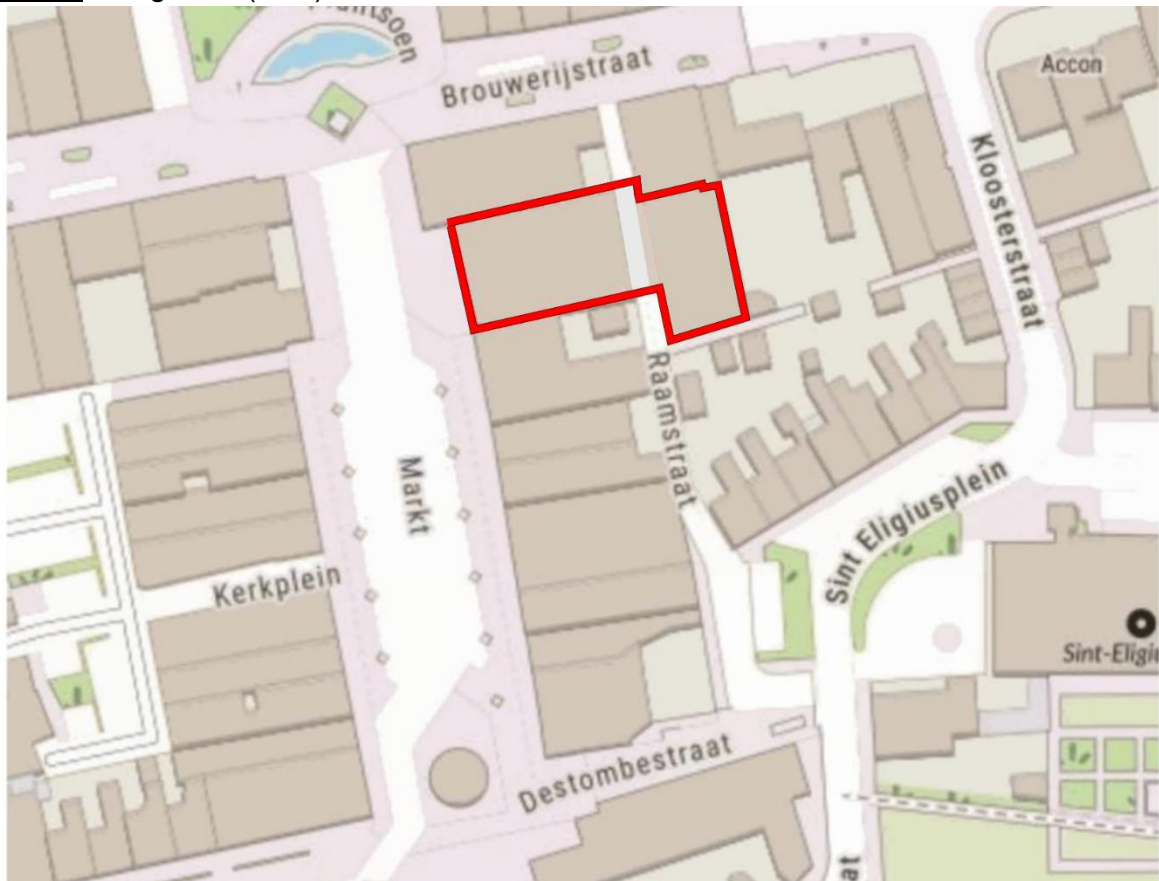
Figuur 1. Plangebied (rood).