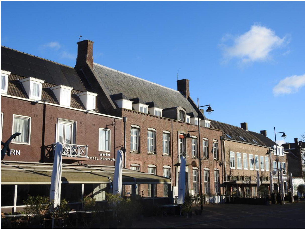
Foto 1. Voorzijde te renoveren bebouwing.

In dit hoofdstuk wordt een korte beschrijving gegeven van de huidige situatie. Het plangebied waar deze quickscan op van toepassing is gelegen in het centrum van Oostburg. Het betreft een voormalig bankgebouw op de locatie Markt 3. De achterzijde van de bebouwing grenst aan de Raamstraat. Via een sluis is hier verbinding naar andere bebouwing. De renovatiewerkzaamheden worden uitgevoerd inpandig en aan de buitenzijde van Markt 3, de sluis en het kantoor aan de Raamstraat 1.