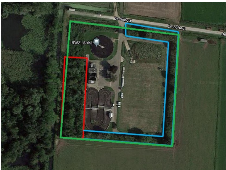
Figuur 1. Luchtfoto van het plangebied (groen) met bosschage aan de westzijde (rood) welke deels verwijderd wordt en te behouden struweel (blauw). In het blauwe deel worden de bomen mogelijk gekapt, maar de stobben blijven behouden (Foto 2022). De vegetatie in de noordwestzijde is reeds verwijderd (zie figuur 2).