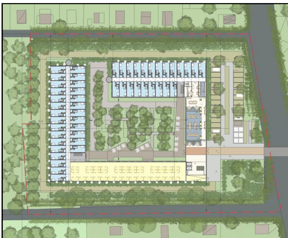
Figuur 1.2: Impressie toekomstige indeling projectlocatie

In onderhavige notitie worden de uitgangspunten voor aanleg- alsmede de gebruiksfase toegelicht.