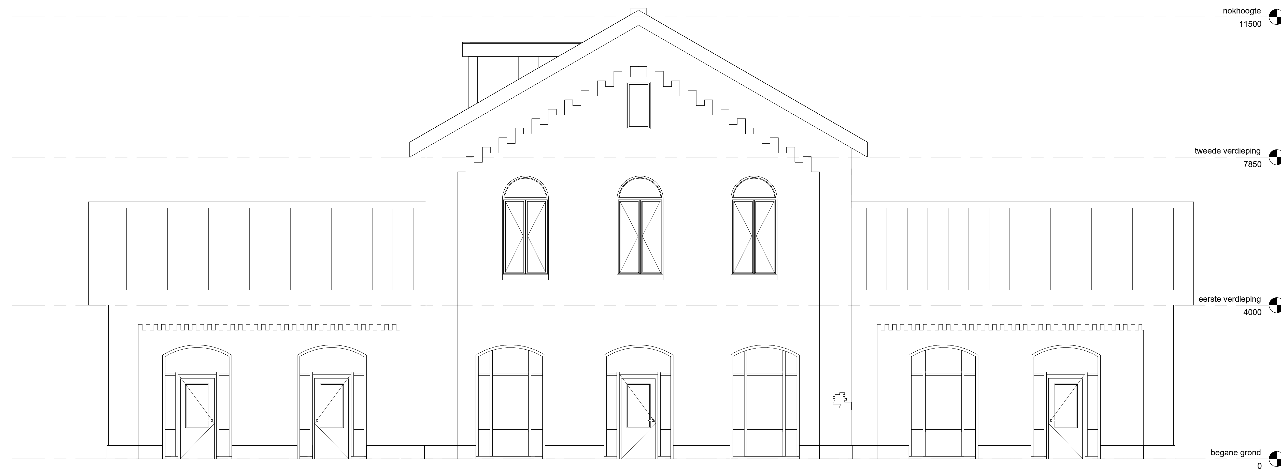
SPOORZIJDE 1 : 50