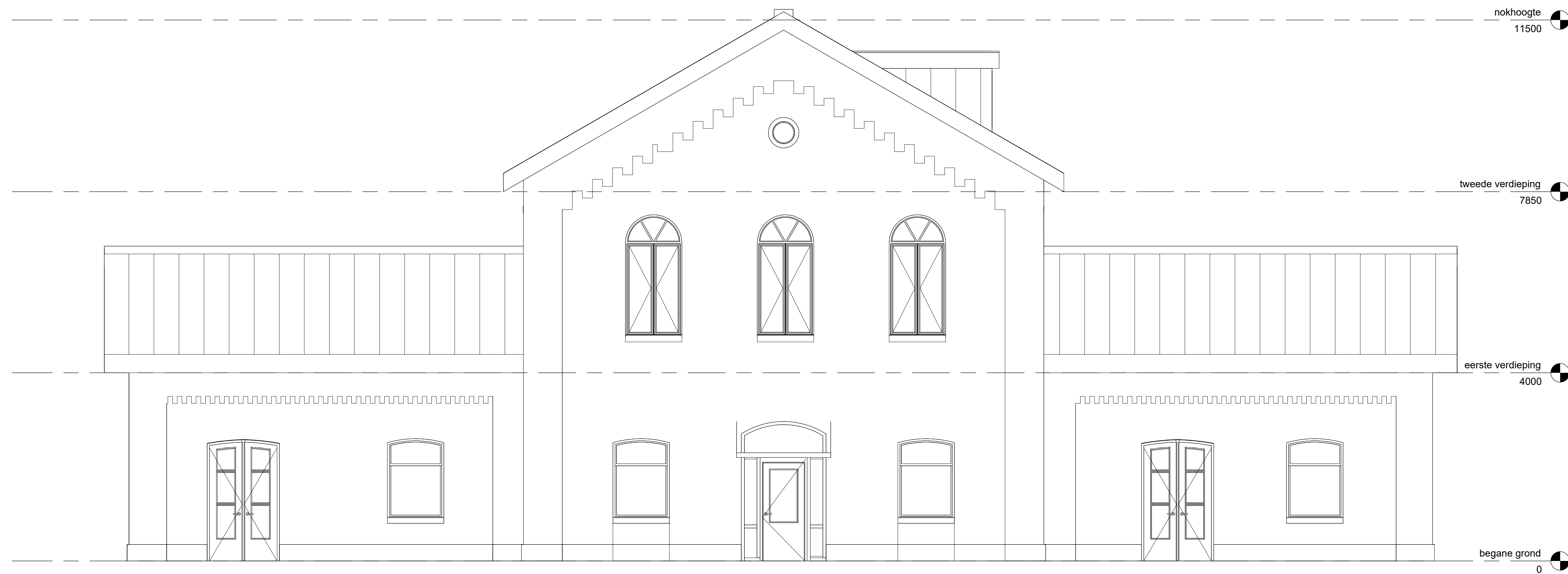
STRAATZIJDE 1 : 50