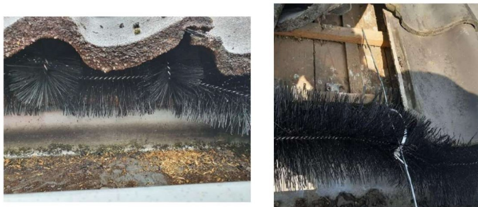
Figuur 4: Dichtzetten van goot met spouwborstels. Borstels met harde haren (maximaal 12 centimeter doorsnede) en korte borstels in holtes om goed af te dichten (links). Bron: Loo Plan. Vastzetten met borstelhaak ter voorkoming loshalen door vogels of marters (rechts). Bron: Unitura.