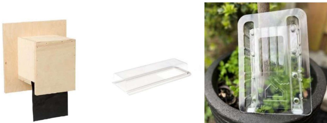
Figuur 2: Prefab VL EF01 van Vivara Pro (links), EF2 van Unitura (midden), VdV bioflap van Verhuis de vleermuis (rechts).

Enkele voorbeelden van exclusion flaps. Deze exclusion flaps zijn ook geschikt voor grotere vleermuissoorten zoals laatvlieger en hebben een minimale doorgang van 50 bij 70 millimeter: