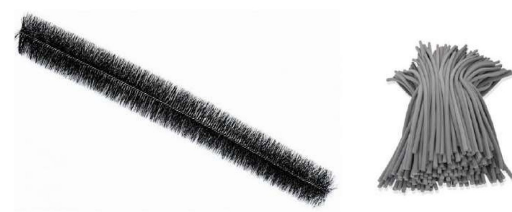
Figuur 1: spouwborstel (links) en vulschuim (rechts) .

Voor het dichtzetten van kieren en spleten over lange afstanden (bijvoorbeeld dakranden) kunnen spouwborstels, houten latten of vulschuim (geen pur) gebruikt worden, mits om de 2,5 meter een geschikte exclusion flap wordt geplaatst en er voldoende vrije doorgang aan de binnenkant is om deze te bereiken. Bij een dakrand aan de kopgevel moeten minimaal 5 exclusion flaps worden geplaatst. Bij open stootvoegen mogen enkele openingen dichtgezet worden, mits vanuit elke mogelijke verblijfslocatie wel binnen 2,5 meter een opening met exclusion flap te bereiken is.