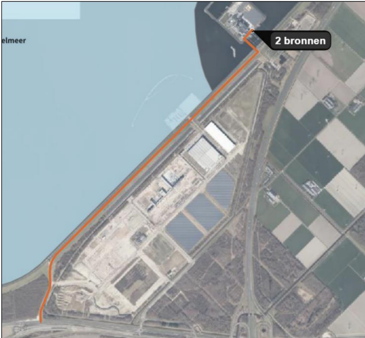
Afbeelding 2: Route vervoersbewegingen.

In de AERIUS-berekening zijn de vervoersbewegingen als lijnbron opgenomen vanaf de Houtribweg (N307) alwaar het verkeer van en naar de Maxima-centrale opgaat in het heersende verkeersbeeld (zie afbeelding 2).