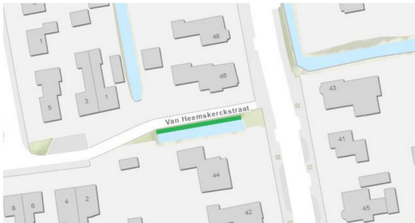
Figuur 3: De groene markering geeft globaal de locatie weer van de te vervangen walbeschoeiing nabij de Van Heemskerckstraat 1 te Bedum.

De vergunningaanvraag is bij waterschap Noorderzijvest geregistreerd onder het zaaknummer 172196. De aanvraag omvat de volgende voor dit besluit relevante stukken: