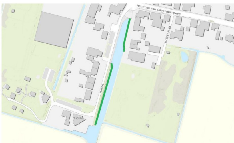
Figuur 1: De groene markering geeft globaal de locatie weer van de te vervangen walbeschoeiing nabij Haven 5 en Haven 20 te Kloosterburen.

Het dagelijks bestuur van het waterschap Noorderzijvest heeft op 24 maart 2026 van [REDACTED] namens [REDACTED] [REDACTED] aanvragen ontvangen om een omgevingsvergunning als bedoeld in artikel 5.1, tweede lid, van de Omgevingswet (Ow). De aanvraag betreft het vervangen van walbeschoeiing nabij Haven 5 en Haven 20 te Kloosterburen en nabij Van Heemskerckstraat 1 te Bedum en het aanleggen van walbeschoeiing nabij Het Aanleg 2 te Winsum, zoals hieronder globaal is weergegeven in de figuren 1-3.