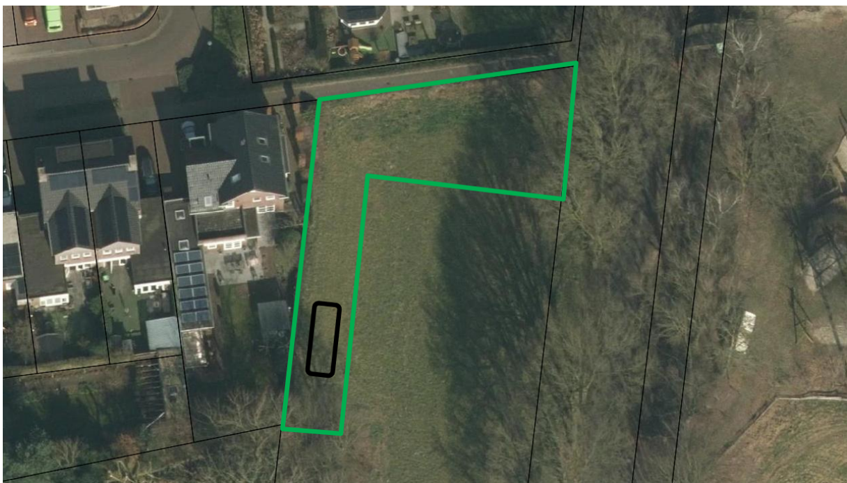
Figuur 5. Uitbreiding van de groenstrook, inclusief zoekgebied plaatsing tweede marterkast.