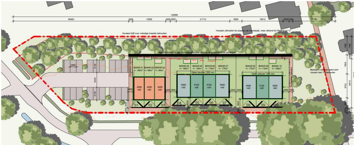
Figuur 5. Indicatie van de nieuwe situatie, inclusief uitbreiding van de groenstrook.