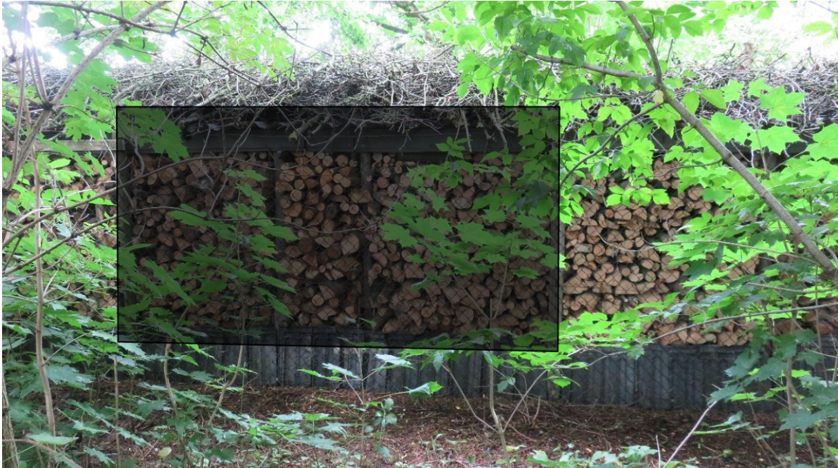
Figuur 3. Indicatie van de plaatsing van het doek om licht en zichtverstoring op de verblijfplaats te voorkomen.