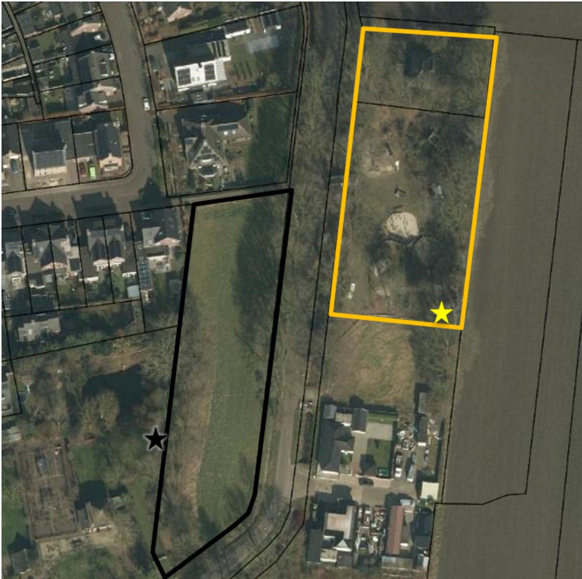
Figuur 2. Locatie van de eerste te plaatsen marterkast (gele ster) in de natuurspeeltuin (gele omlijning) ten opzichte van de aangetroffen verblijfplaats (zwarte ster) en het plangebied (zwarte omlijning).