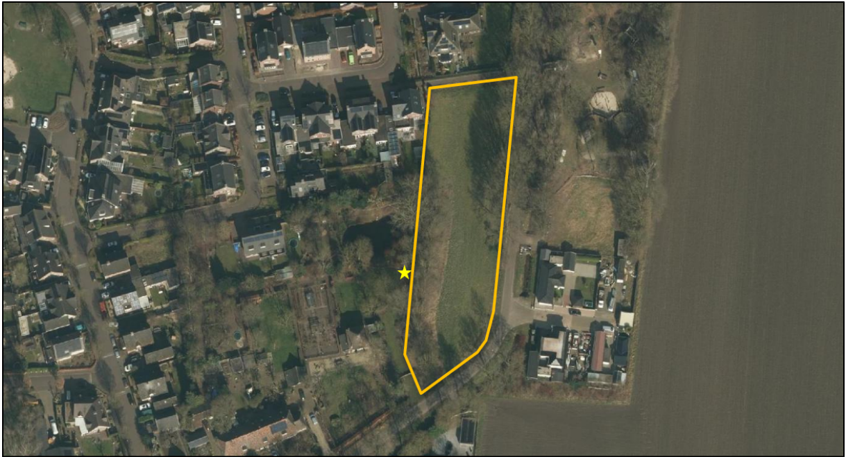
Figuur 1. Locatie 't Oliemeulen te Schaijk. De activiteiten vinden plaats binnen het omljnde gebied. De locatie van de aangetroffen marterverblijfplaats aangegeven met een gele ster.