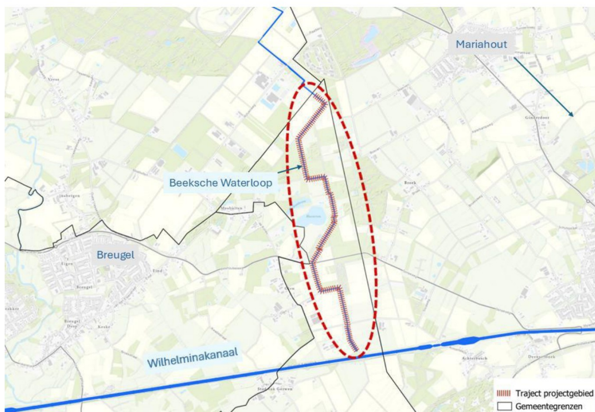
Figuur 1: projectgebied "EVZ Beeksche Waterloop Zuid, Nuenen" (rode stippellijn).

Het projectgebied waar de voorgenomen inrichtingsmaatregelen zullen worden uitgevoerd, loopt vanaf de inlaat bij het Wilhelminakanaal tot de gemeentegrens van de gemeente Nuenen, net voorbij de Duykenpaalse Heiweg (zie Figuur 1-1). Het projectgebied is daarmee volledig gelegen in de gemeente Nuenen.