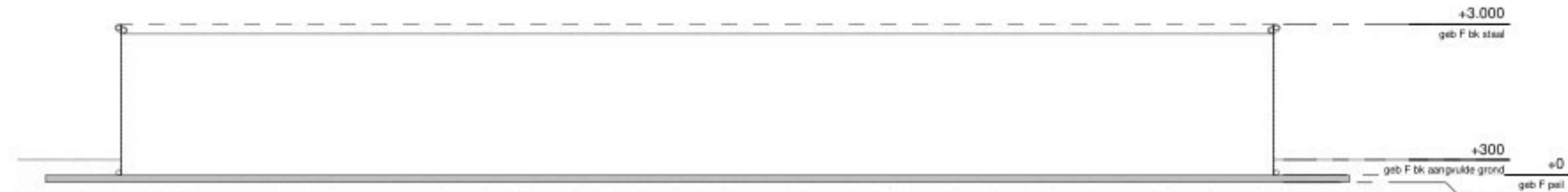
doorsnede E en F