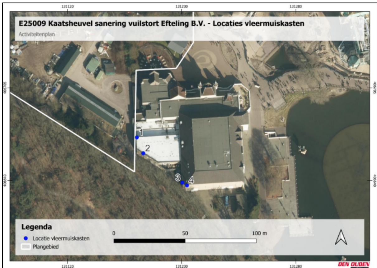
Figuur 2. Locatie van de tijdelijke vloermuiskasten.