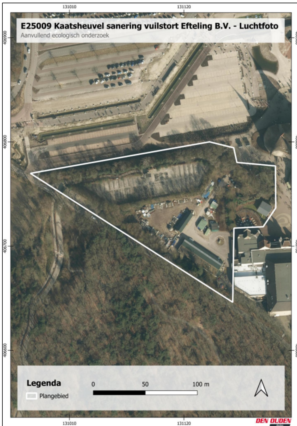
Figuur 1. Locatie Kaatsheuvel sanering vuilstort Efteling B.V. De activiteiten vinden plaats binnen het omliggende gebied.