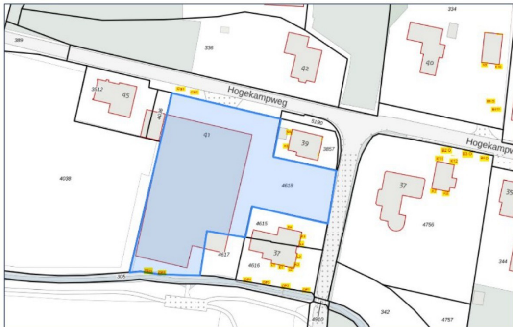
Figuur 2 Locatiebepalingen van de tijdelijke vleermuisvoorzieningen die in 2025 zijn geplaatst. Er zijn er 22 geplaatst, 10 op gebouwen, 6 op bomen en 6 op palen. In deze figuur zijn 12 locaties op huizen aangegeven, maar hiervan zijn er 2 weggehaald.