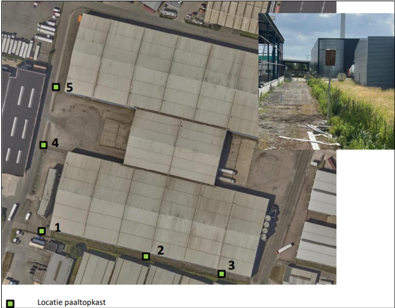
Figuur 3. Locaties van de tijdelijke voorzieningen.