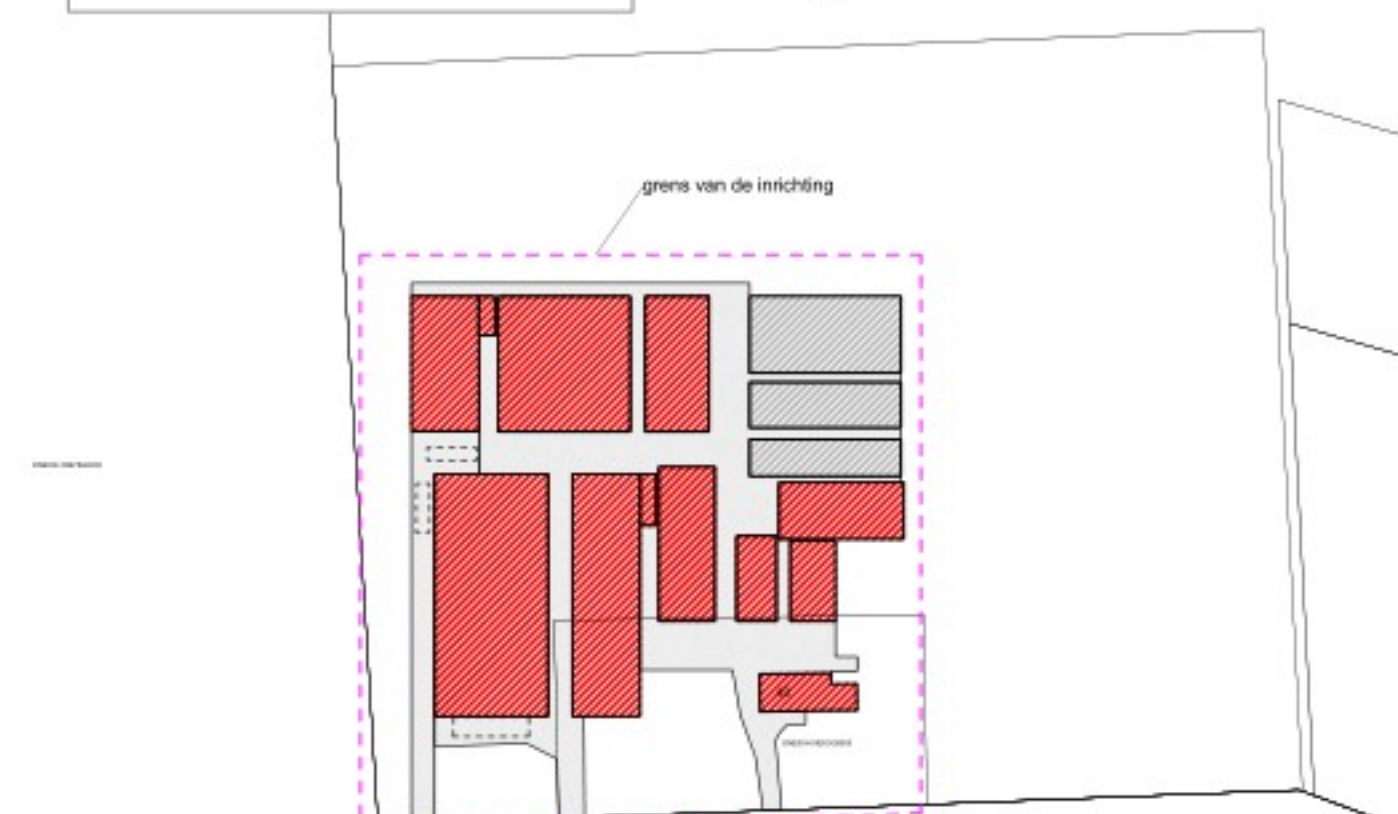
TEKENING BEHORENDE BIJ DE AANVRAAG OMGEVINGSVERGUNNING ACTIVITEIT MILIEU